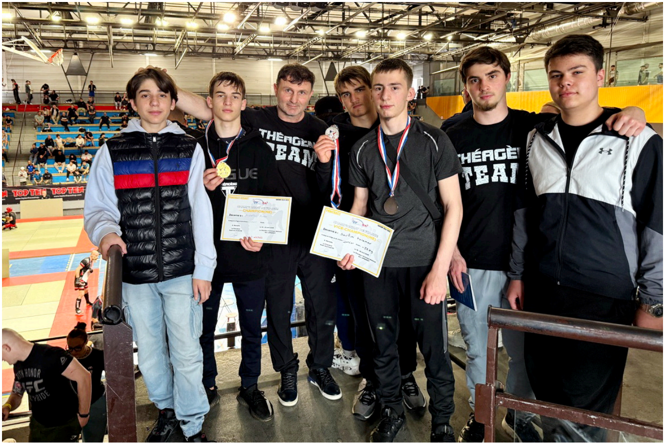
Команда «Теаген» в Марселе