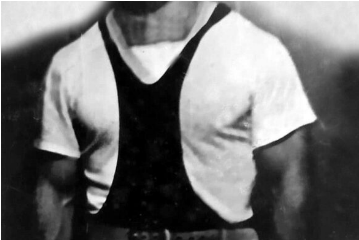
Среди участников художественной спортивной группы работников