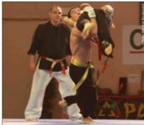
De la ferveur avec 450 spectateurs présents, samedi soir, les « World Challenge Modern Martial Arts » ont été d'une grande intensité.