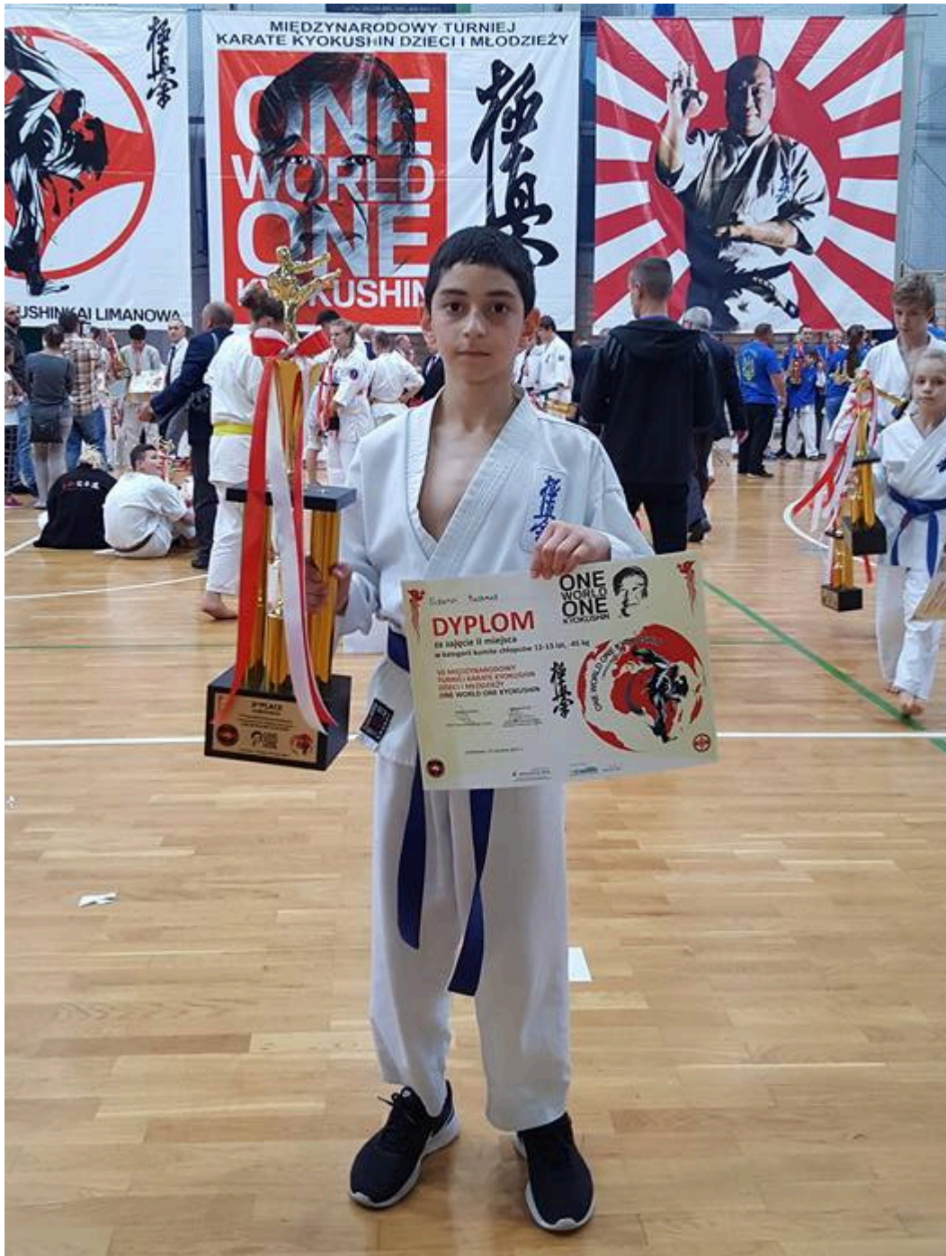
Бронзовый призер турнира в Польше Магомед Эльдаров