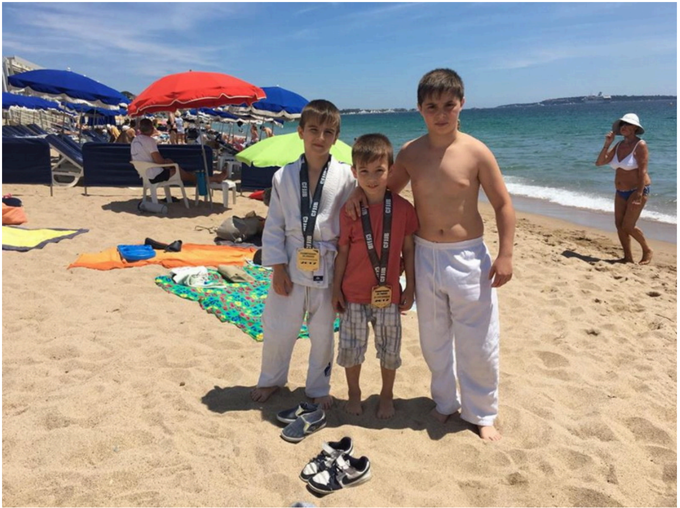
После победы - на пляж