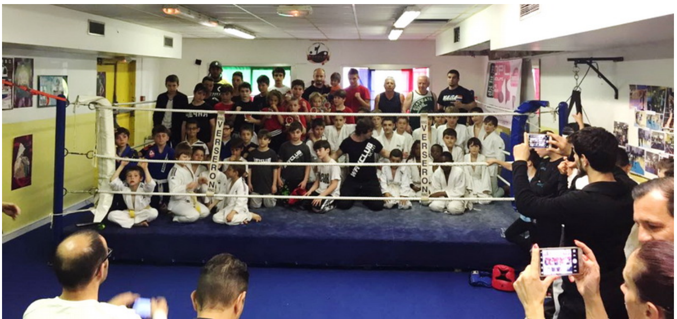
Участники 2-го Кубка Вайклуба после соревнований