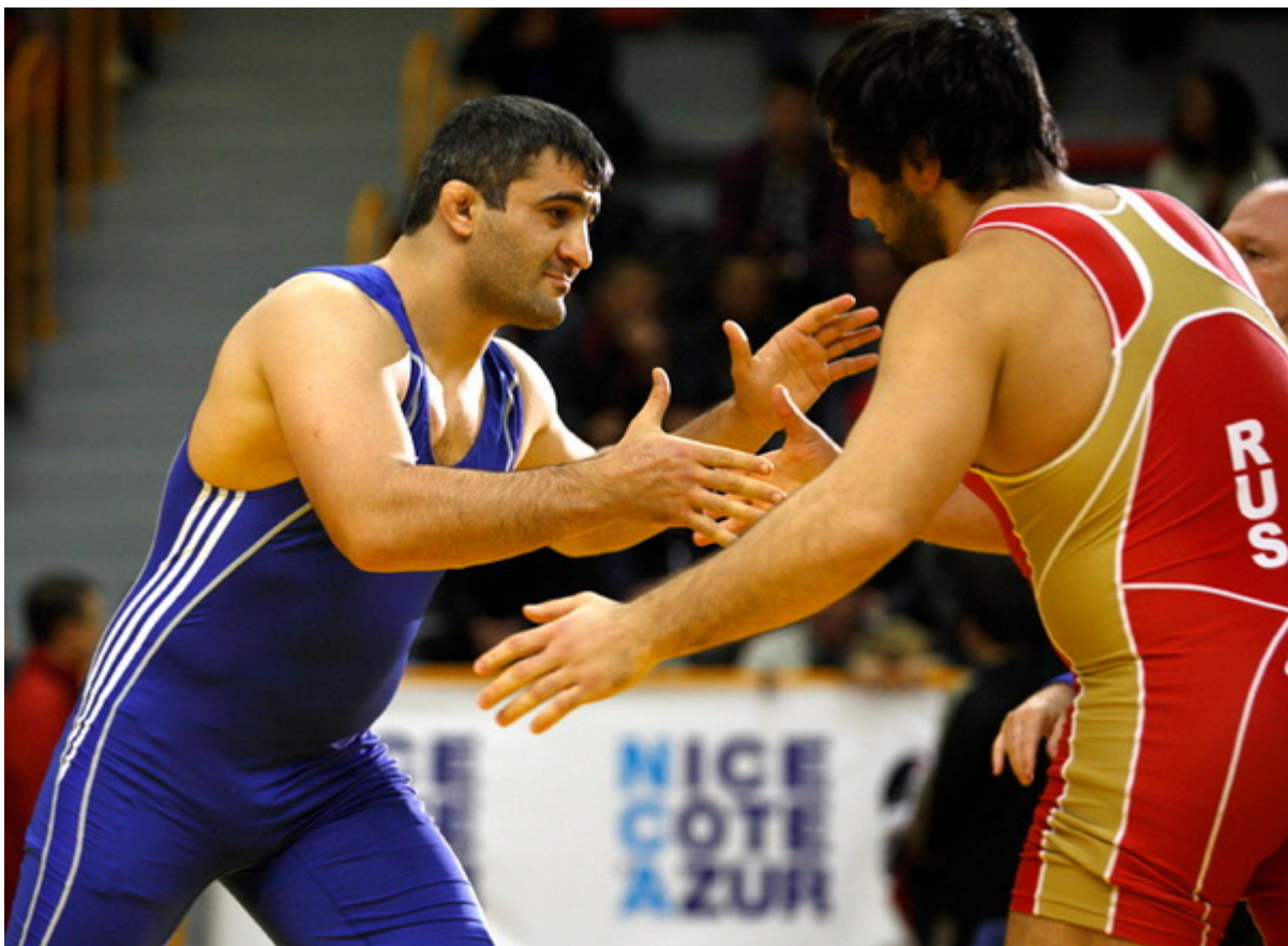
Турнир Анри Деглан, 2010г.