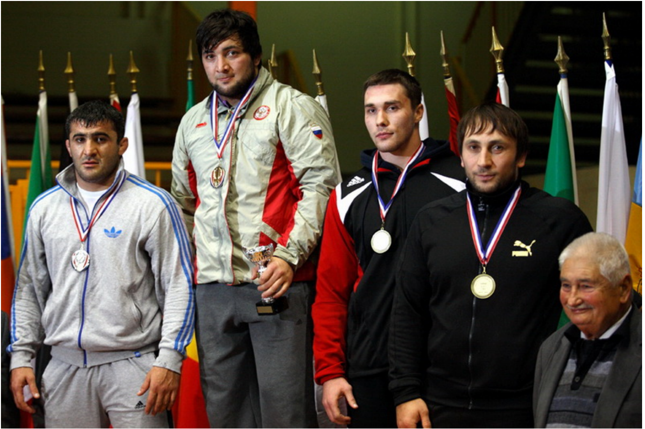
Турнир Анри Деглан, 2010г.