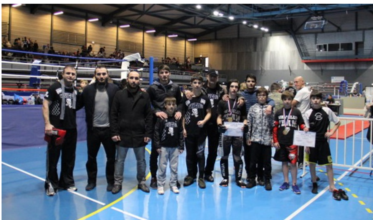
Команда Wayclub в Марселе 17.12.2017г.