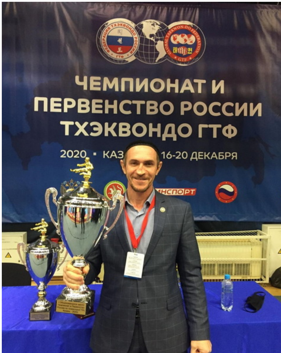
Президент Федерации тхэквондо ЧР Муса Ясаев