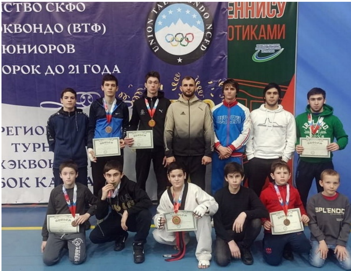
Чеченские тхэквондисты – призеры первенства СКФО