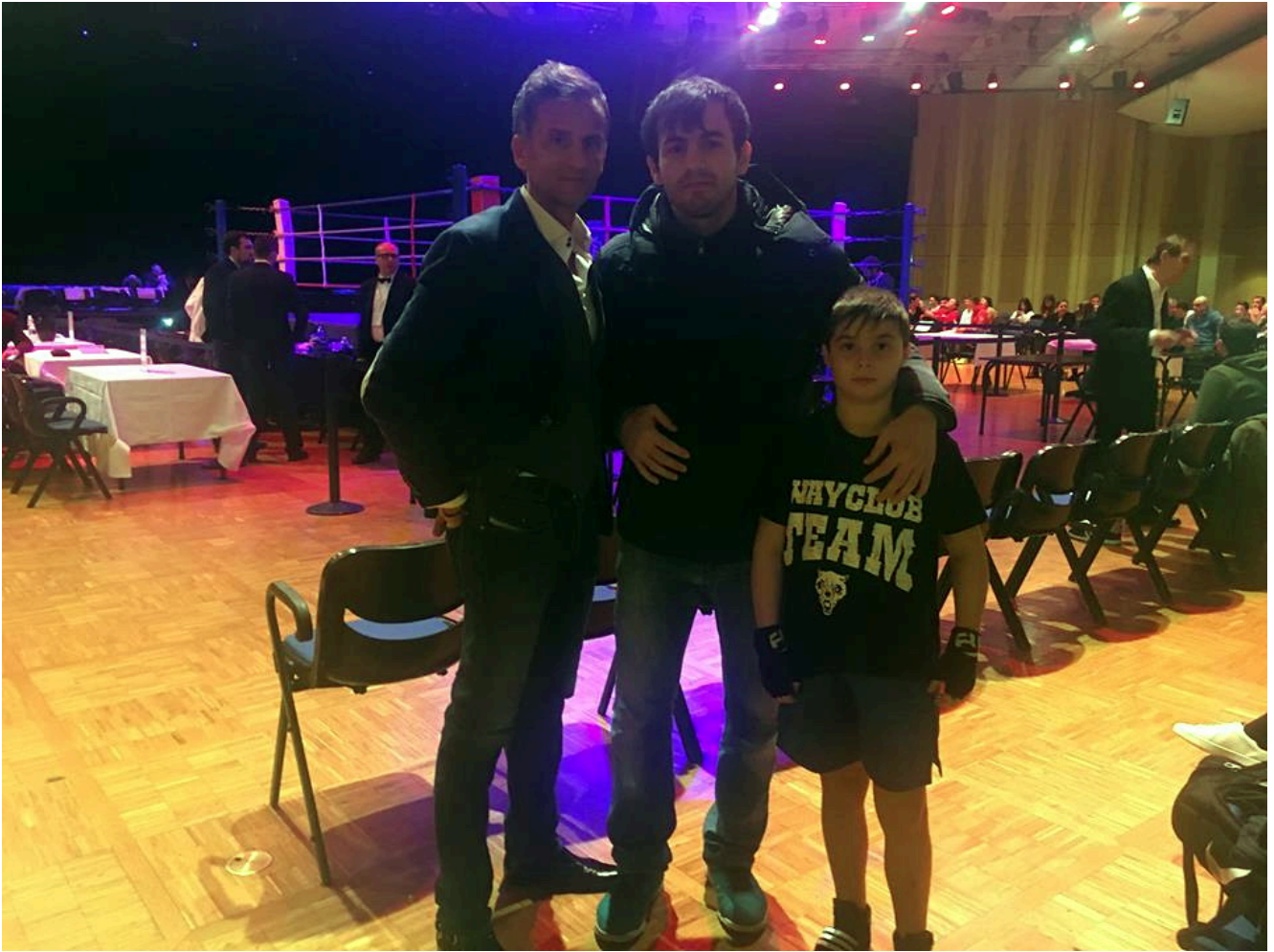
Чемпион Франции Сулиман Абдурашидов