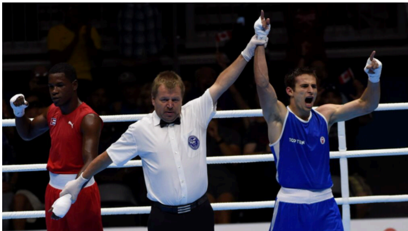
Артур Биярсланов выигрывает Панамериканские игры-2015

Лезгинка победителя. Артур Биярсланов выиграл Панамериканские игры-2015.