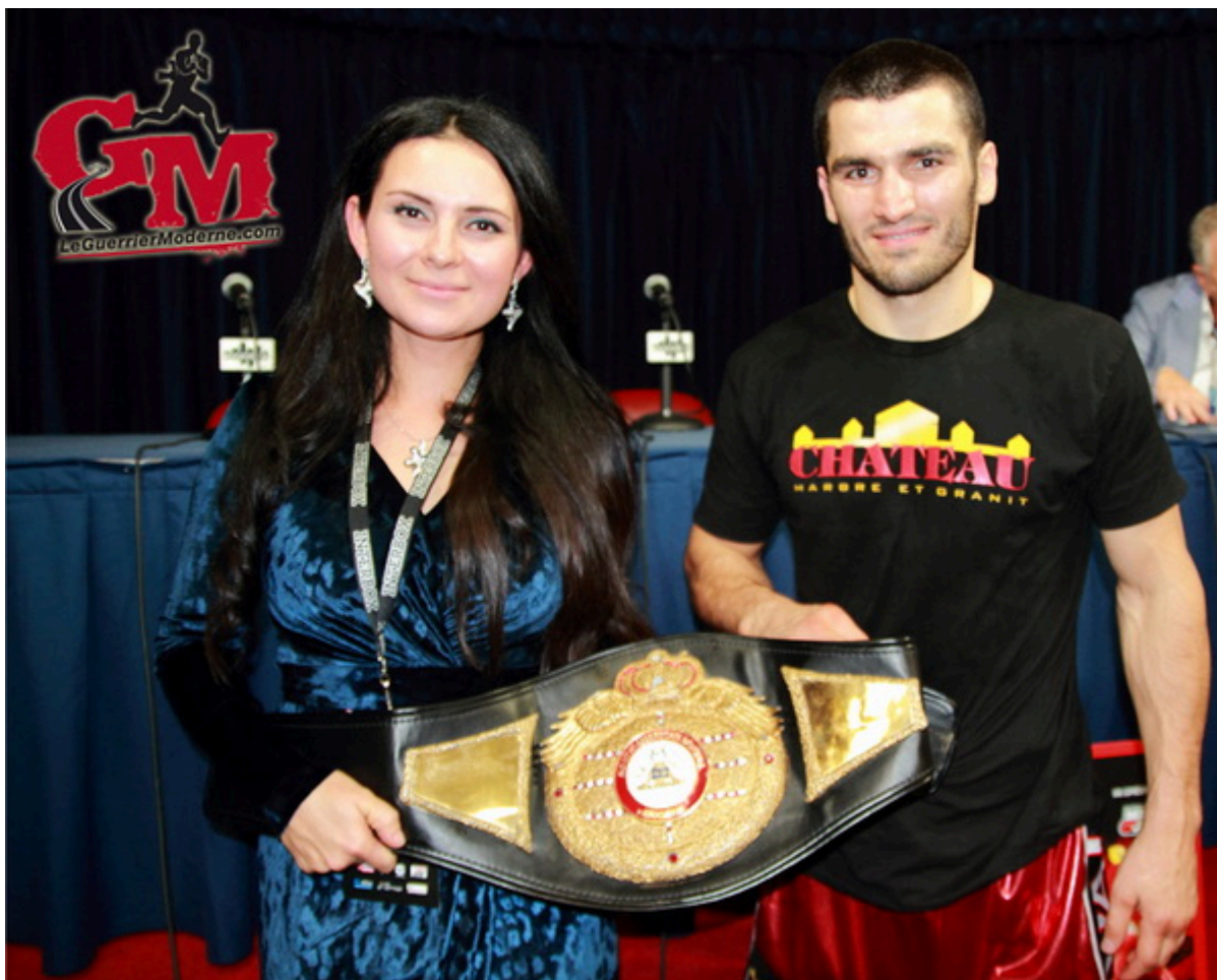
Анна Рева и Артур Бетербиев