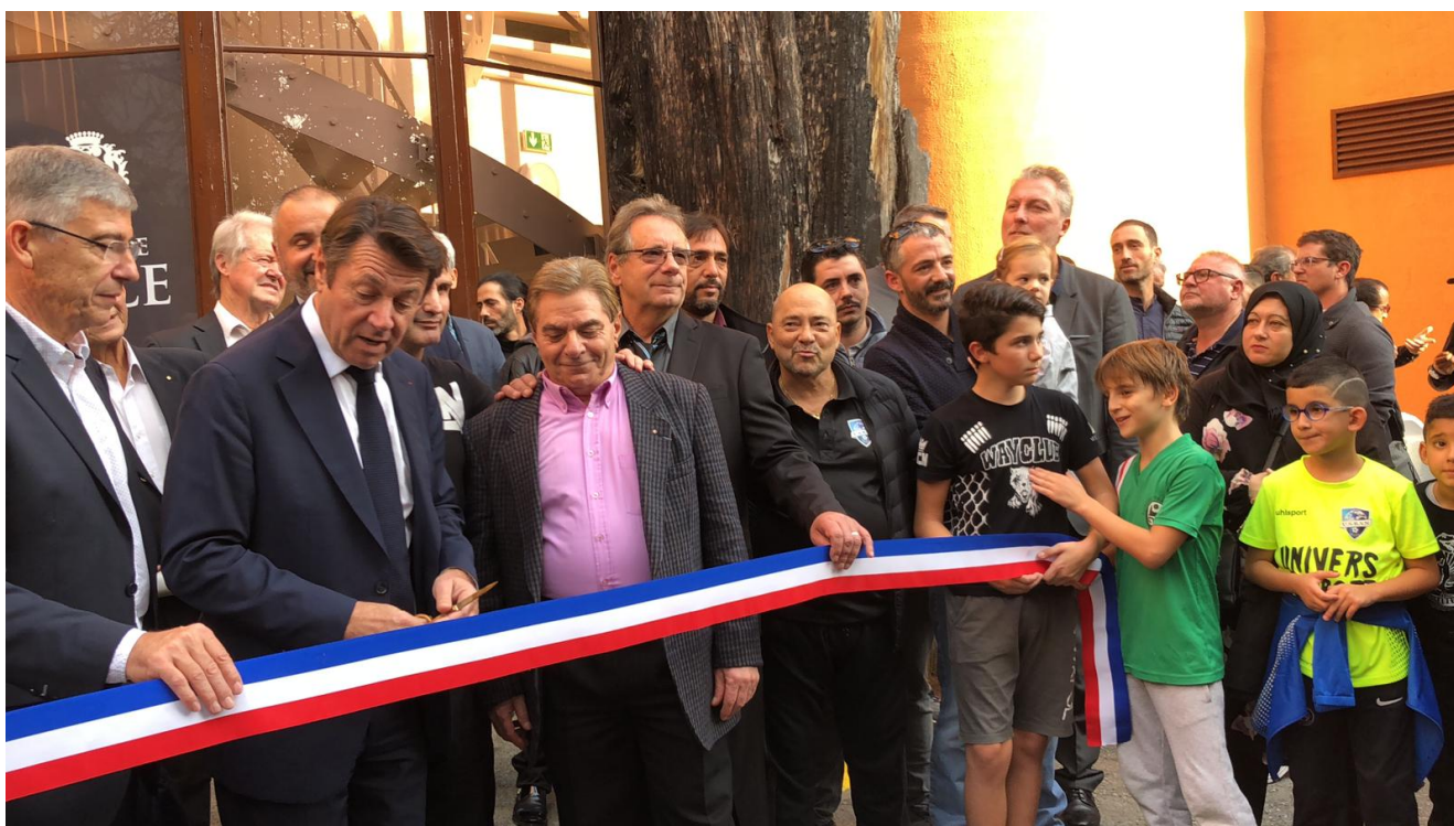
Мэр Ниццы Кристиан Эстрози перерезает ленточку

[youtube id=»70_dUeFrPE4″ width=»600″ height=»350″]