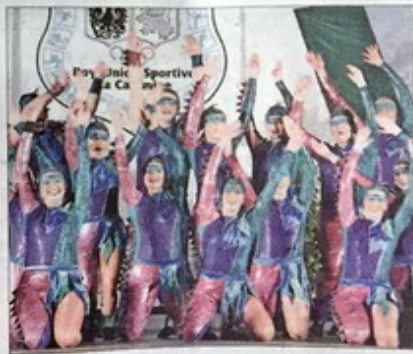
Die Cobras vom TSC Dance Feet Kelmis wurden zur Mannschaft des Jahres gewählt.