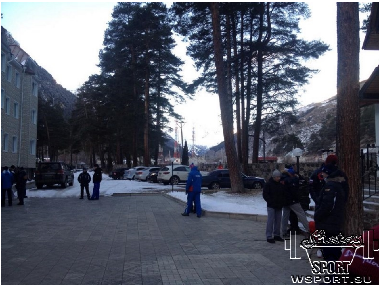
Тренировочная база сборной России в Приэльбрусье. 17 декабря 2014г.