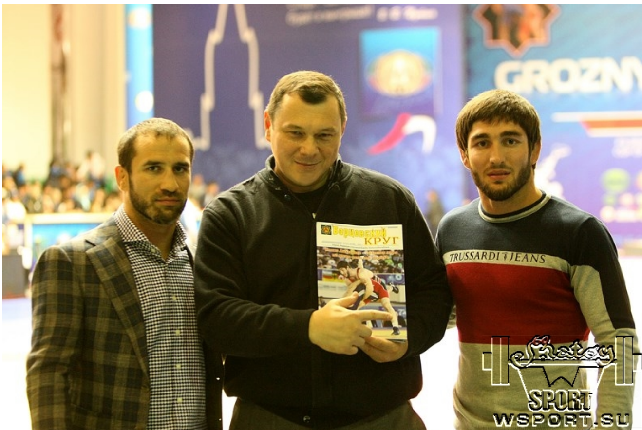
Олимпийский чемпион Ислам-Бек Альбиев, главный редактор журнала "Борцовский Круг" Муслим Гапуев, чемпион мира Чингиз Лабазанов. ред