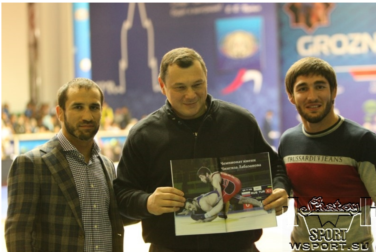
Олимпийский чемпион Ислам-Бек Альбиев, главный редактор