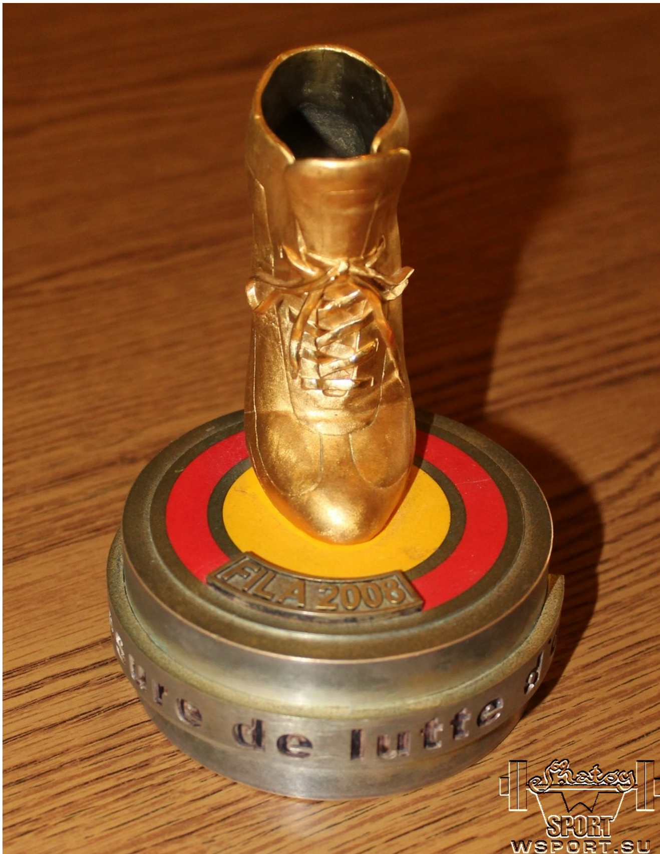
"Золотая борцовка" Бувайсара Сайтиева