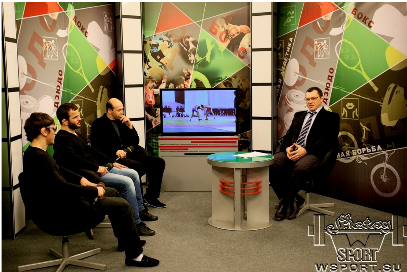
Во время записи 3-го выпуска передачи "Борцовский клуб" (2014 г.)