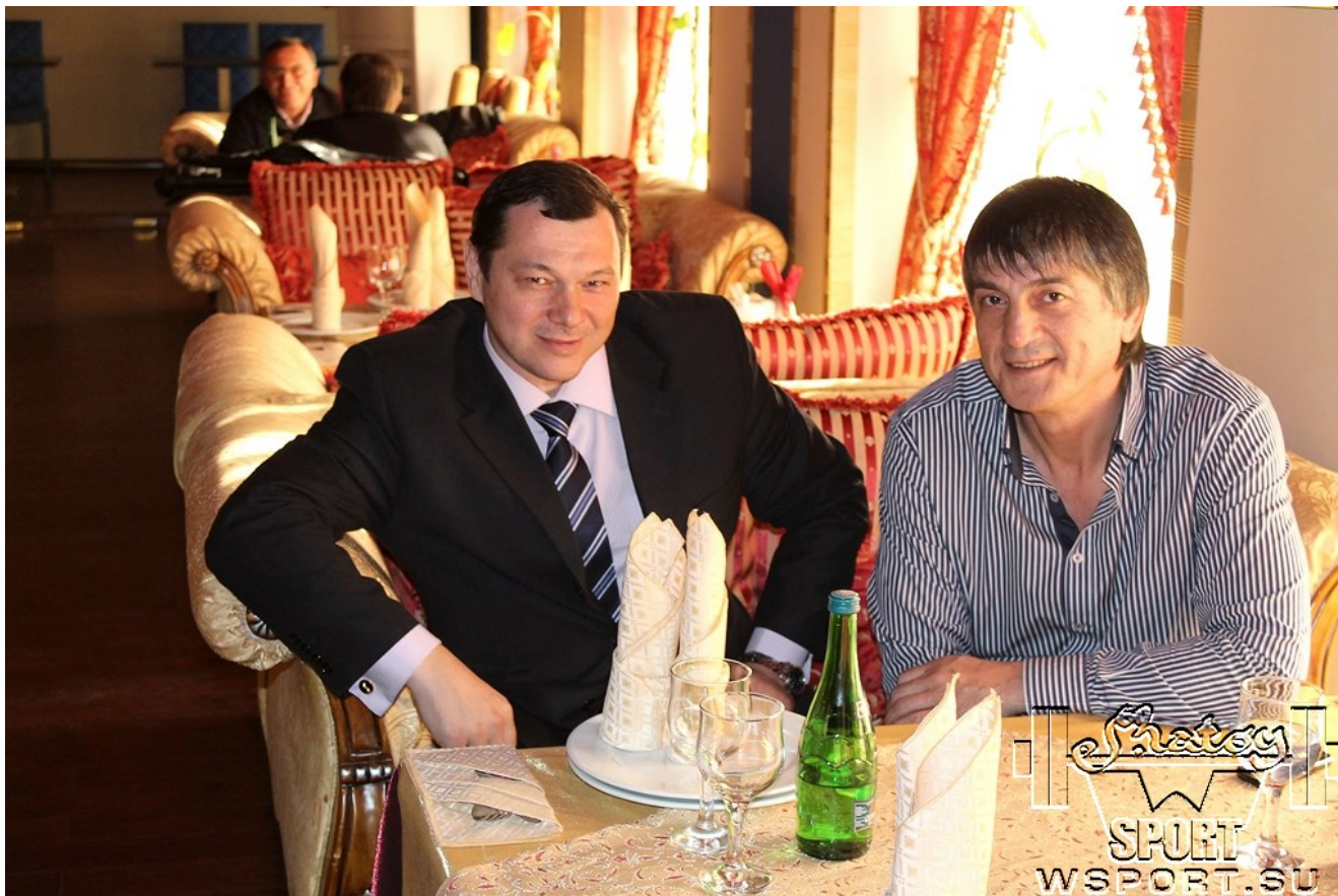
С чемпионом мира 1989 года по вольной борьбе, чемпионом мира в абсолютной весовой категории 1989 года, обладателем Кубка мира 1989 года Ахмедом Атавовым (26 октября 2013 г.)