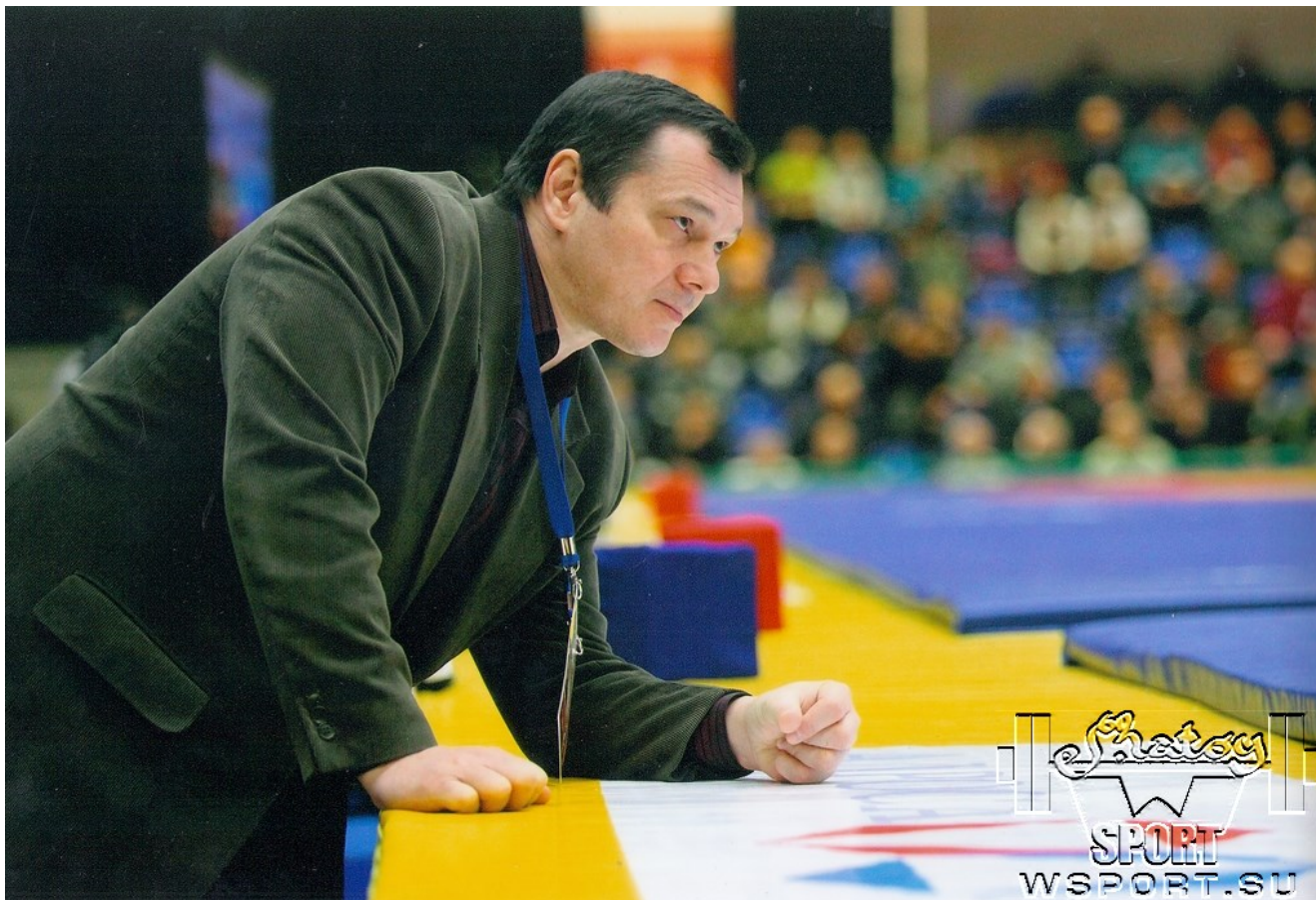
На турнире "Гран-При Иван Поддубный", г.Тюмень, январь 2014г.