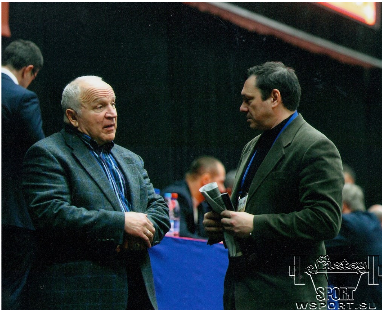
С 2-кратным чемпионом Олимпийских Игр и 5-кратным чемпионом мира Валерием Резанцевым.