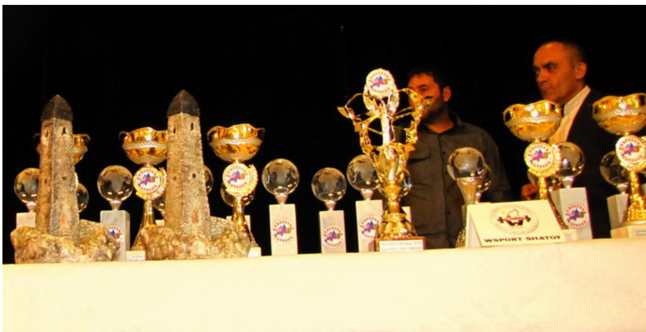
Награды ждут своих обладателей