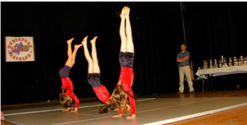
Показательные выступления гимнасток