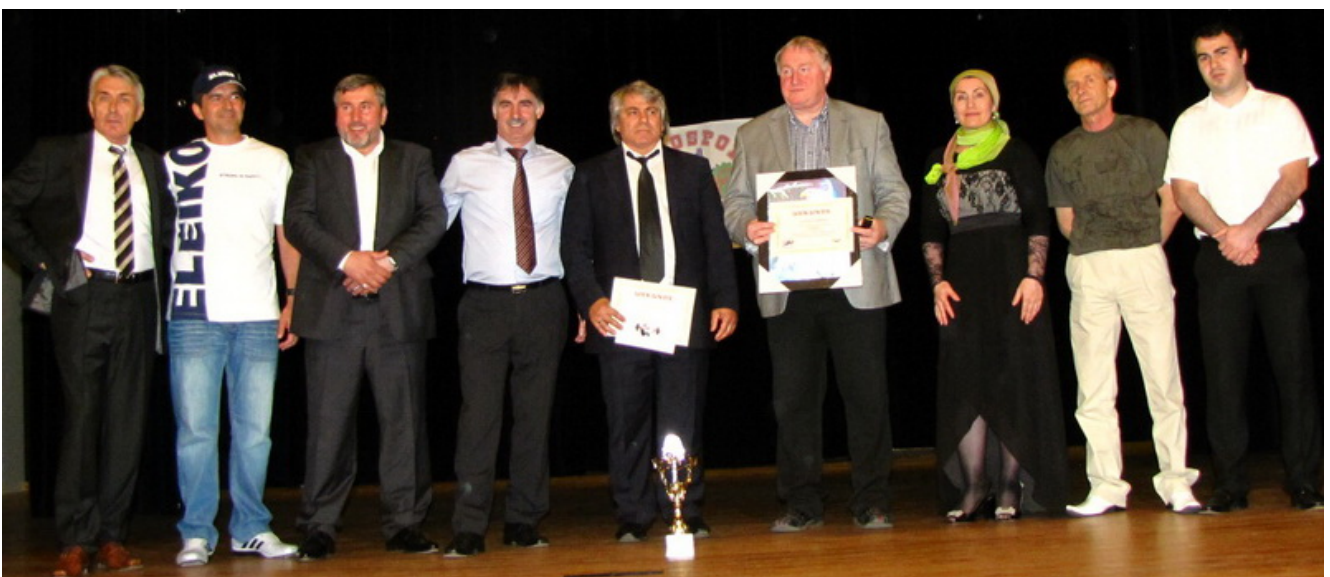
Организаторы мероприятия вместе с лучшим спортсменом