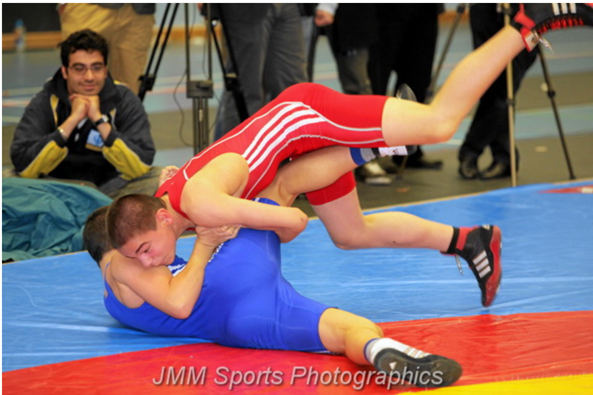
JMM Sports Photographics