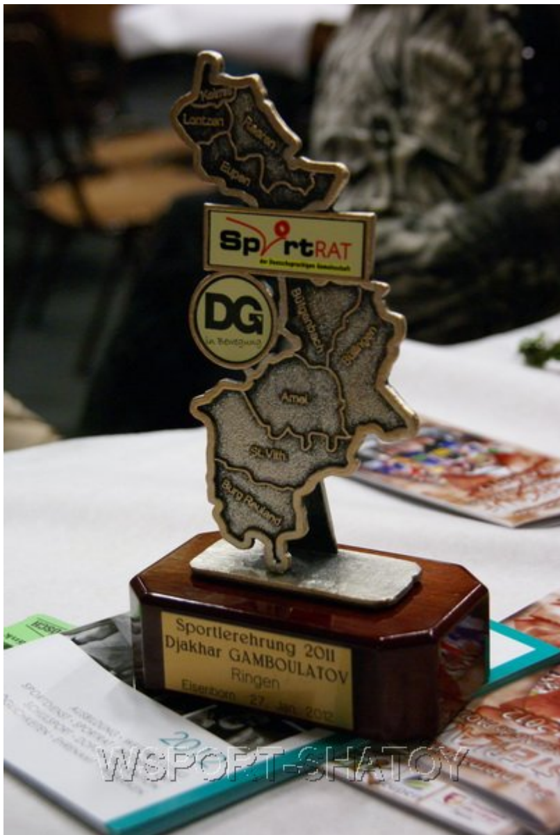
Приз лучшего спортсмена Восточной Бельгии