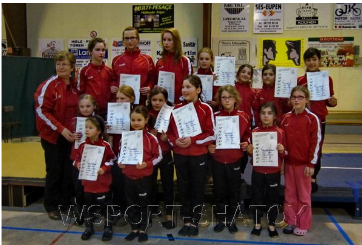
Команда гимнастического клуба Келмис