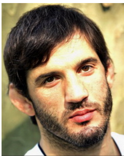
Бувайсар Сайтиев, вольная борьба

Впервые в истории чеченского народа олимпийским чемпионом стал Бувайсар Сайтиев.