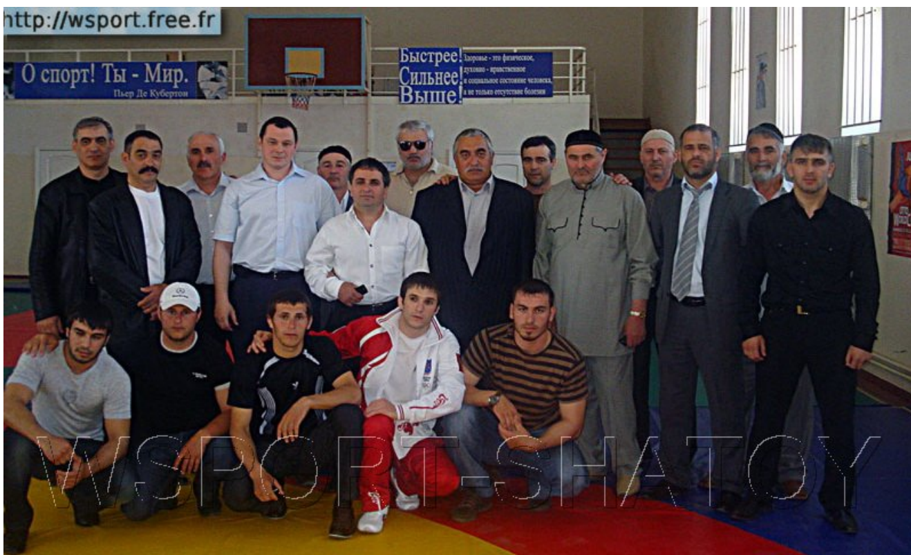
В завершение - фото на память.