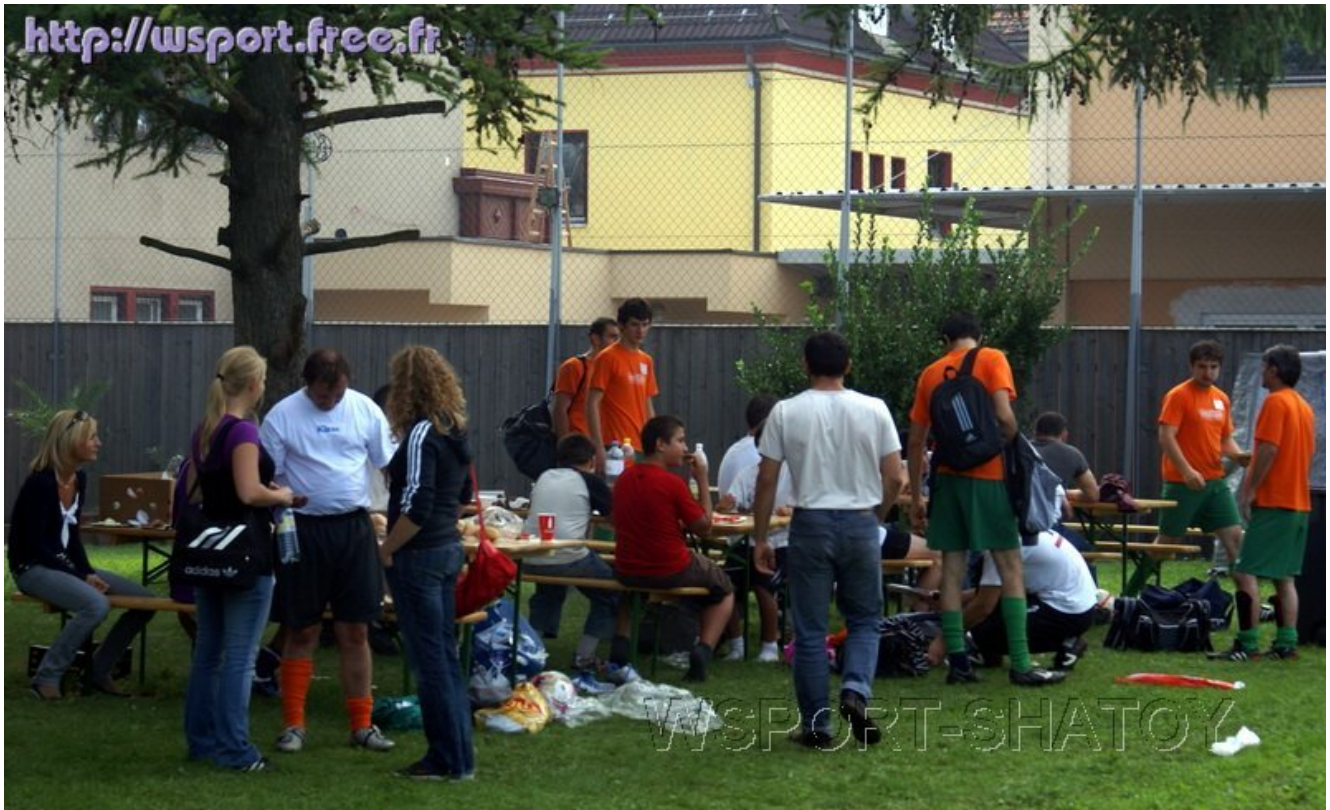
После турнира - шашлыки