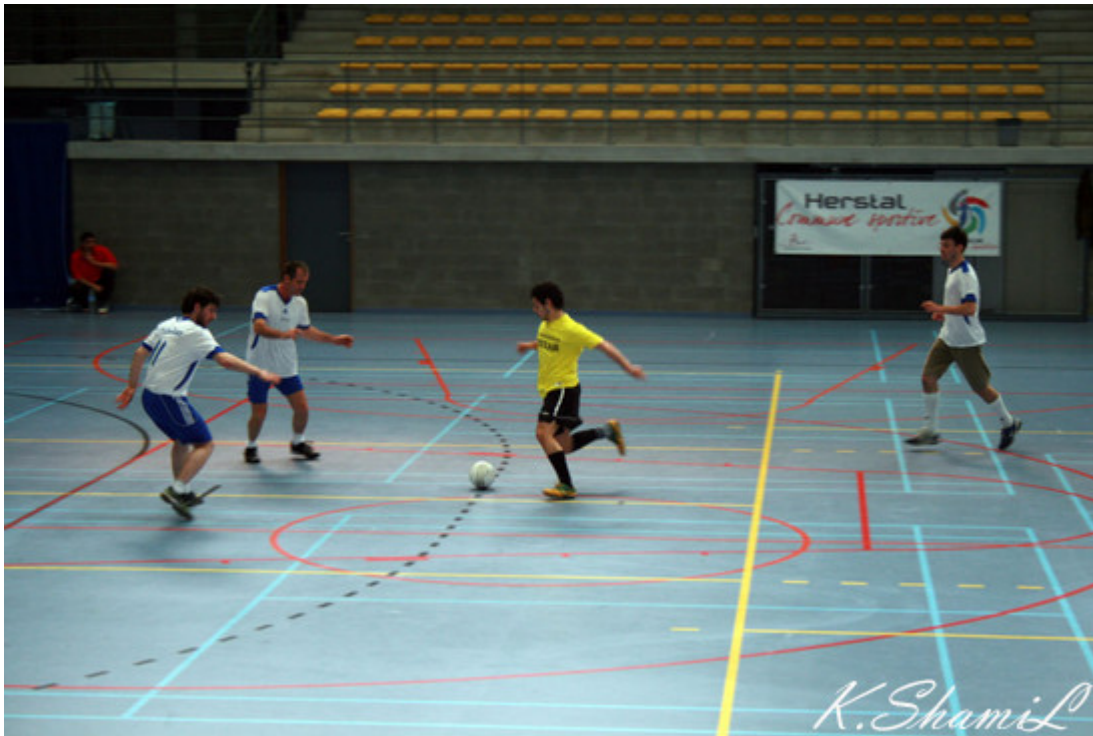
Иду на прорыв