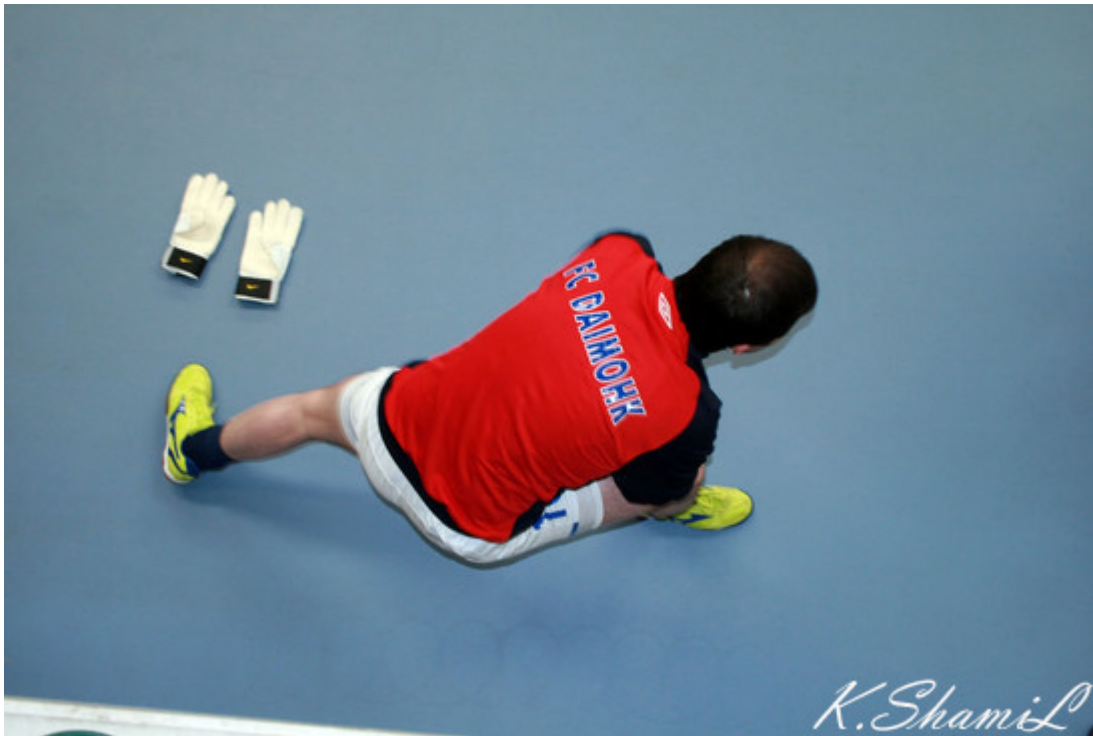
Вратарь "Даймохка" разминается