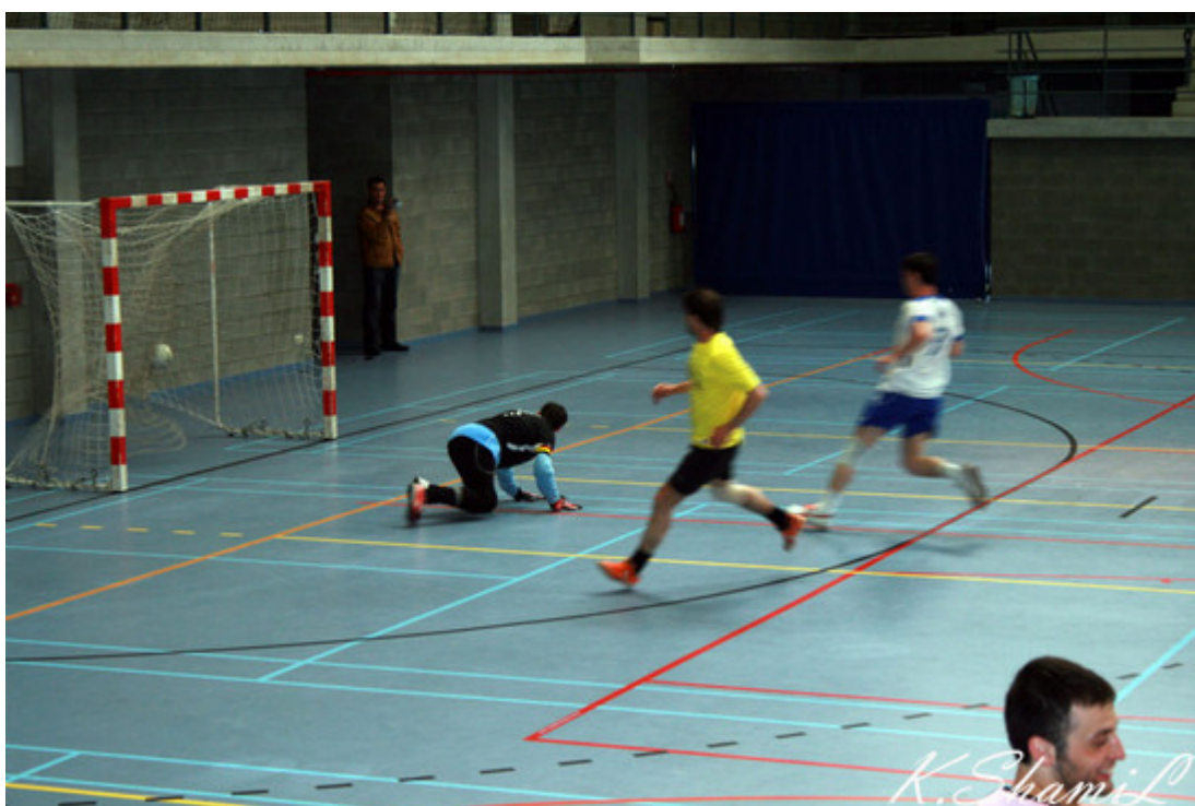
Мяч в воротах