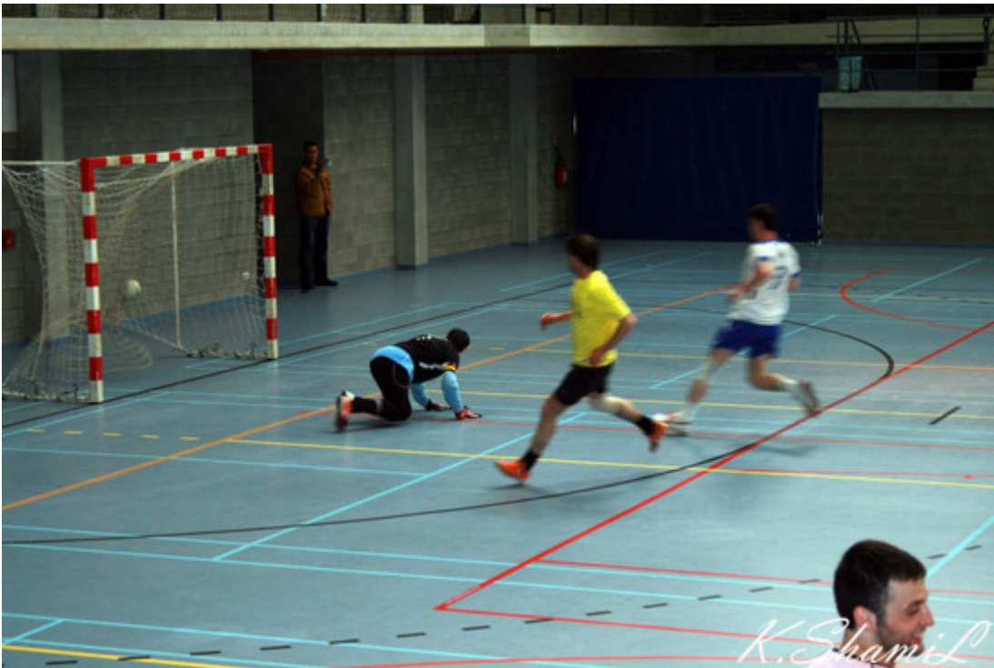
Мяч в воротах