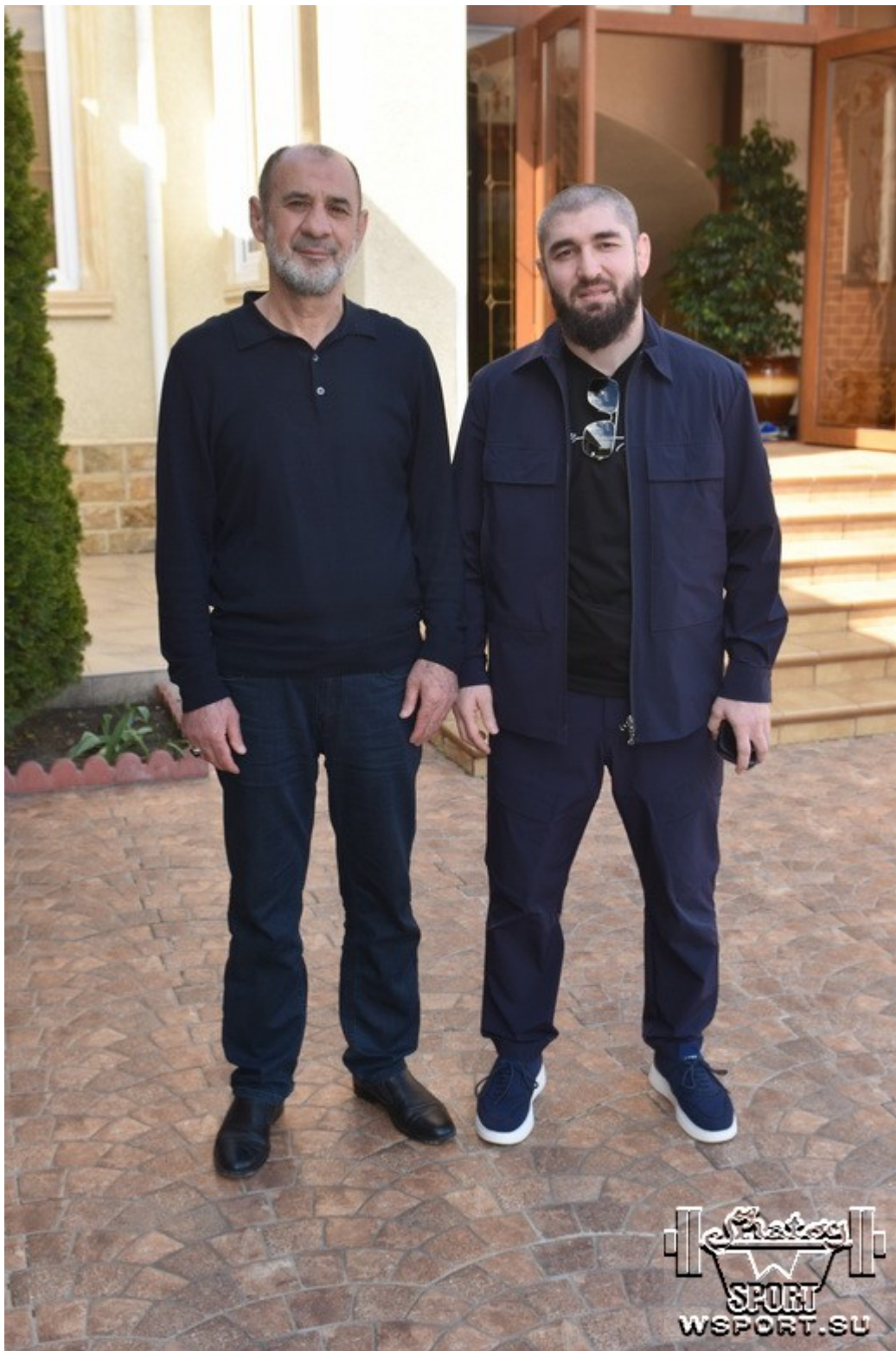
Ибрагим Таймасханов и чемпион мира-2014 Чингиз Лабазанов