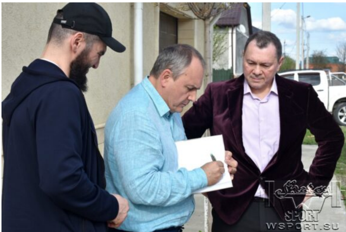
Владимир Иваницкий подписывает книгу Артуру Бетербиеву