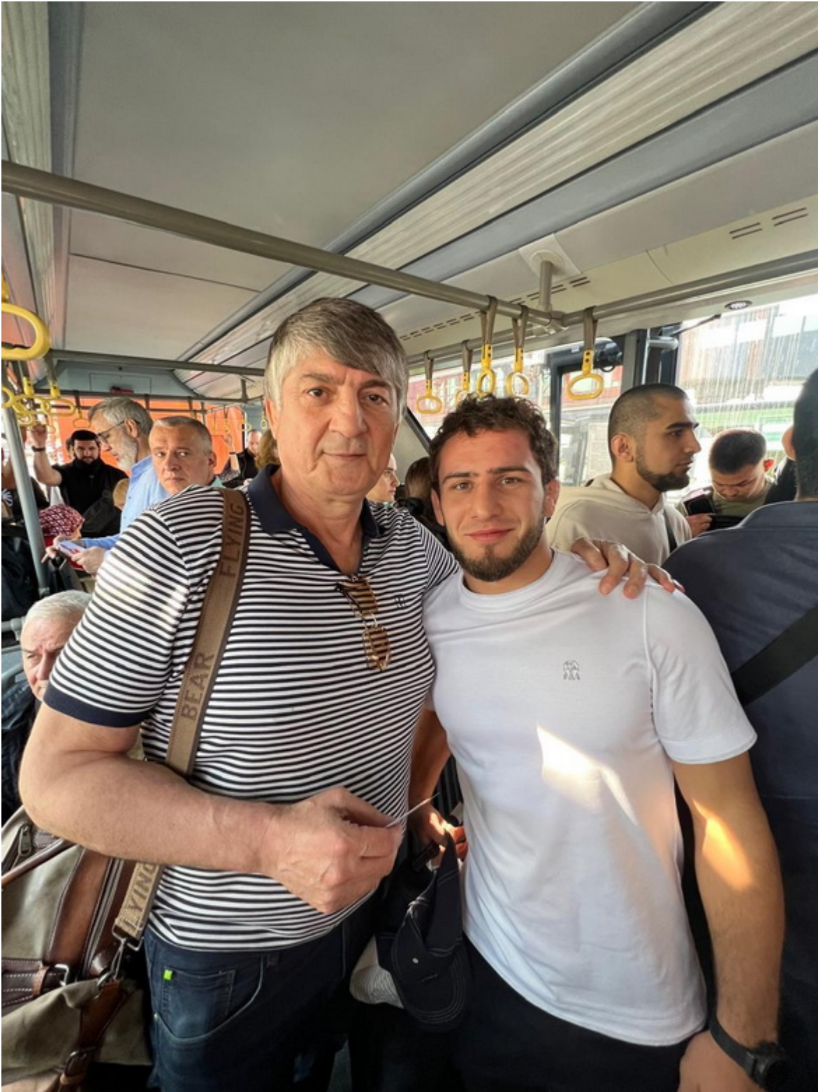
Ахмед Атавов и олимпийский чемпион Парижа-24 Разамбек Жамалов