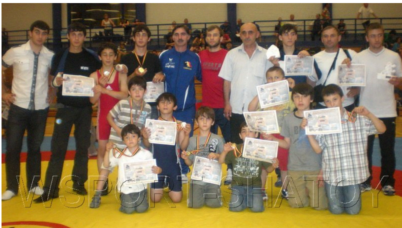
Группа чеченских тренеров и спортсменов после соревнований