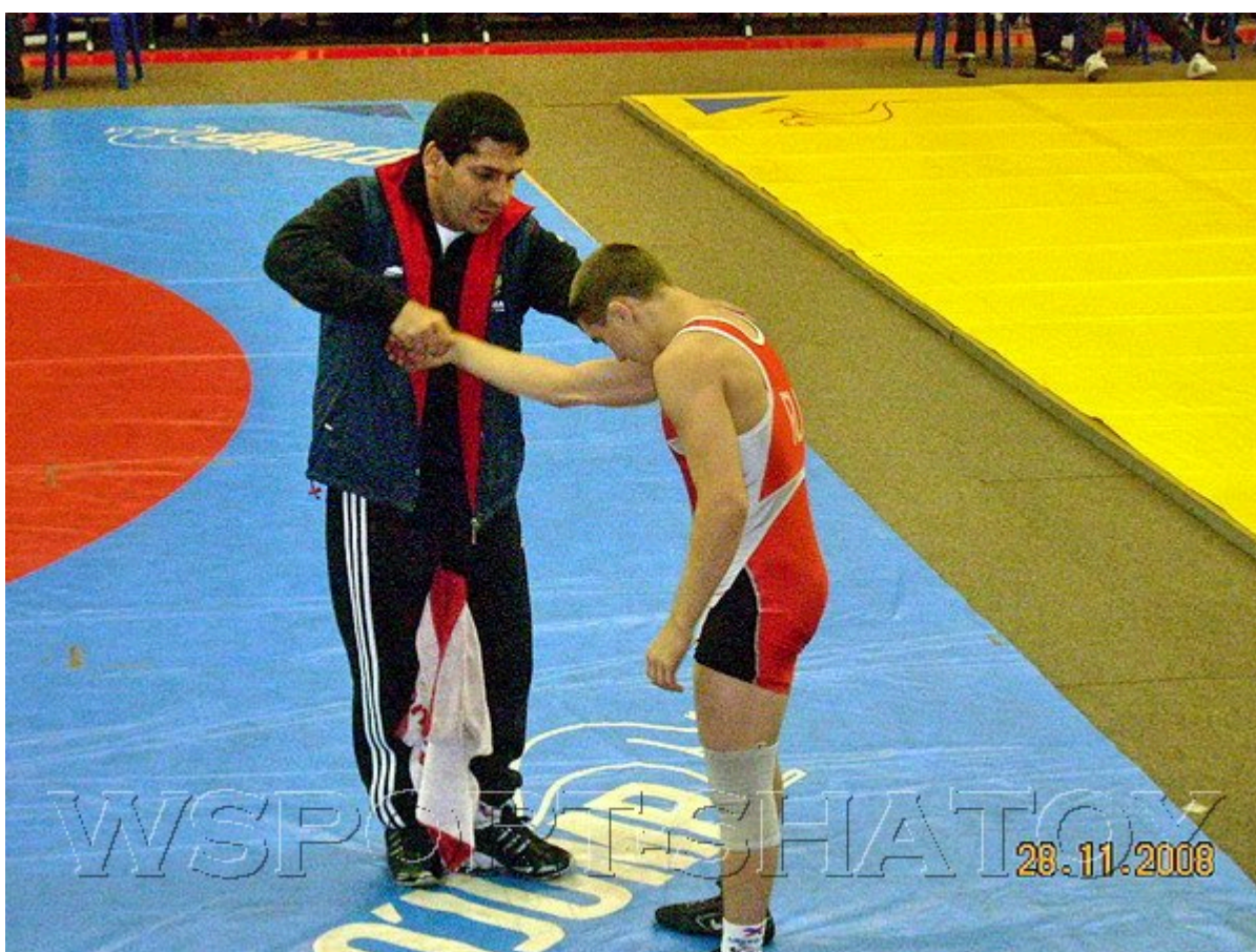
Знаменитый чеченский борец греко-римского стиля, 4-кратный чемпион мира, серебряный призер Олимпийских Игр-92 Ислам Дугучиев работает ныне тренером сборной России