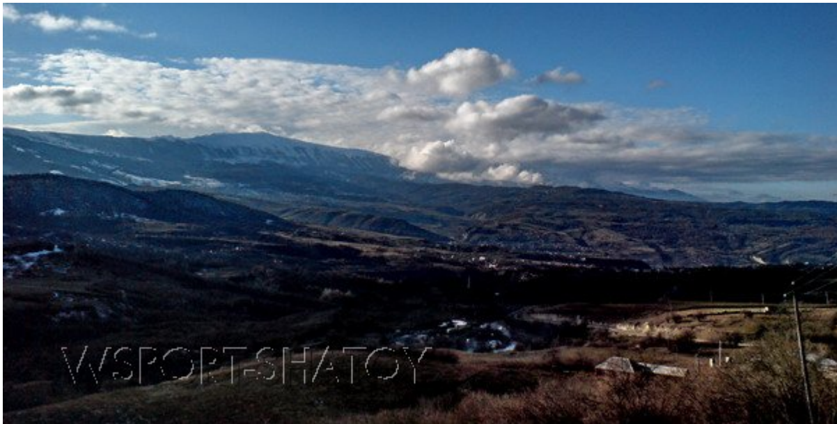
Шатой вдали. Январь 2008 г.