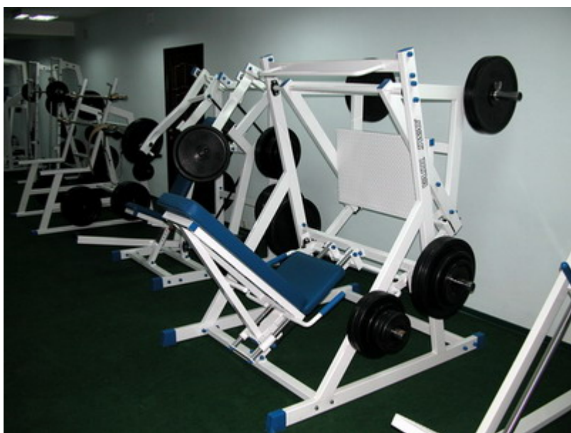
Тренажеры - что надо.