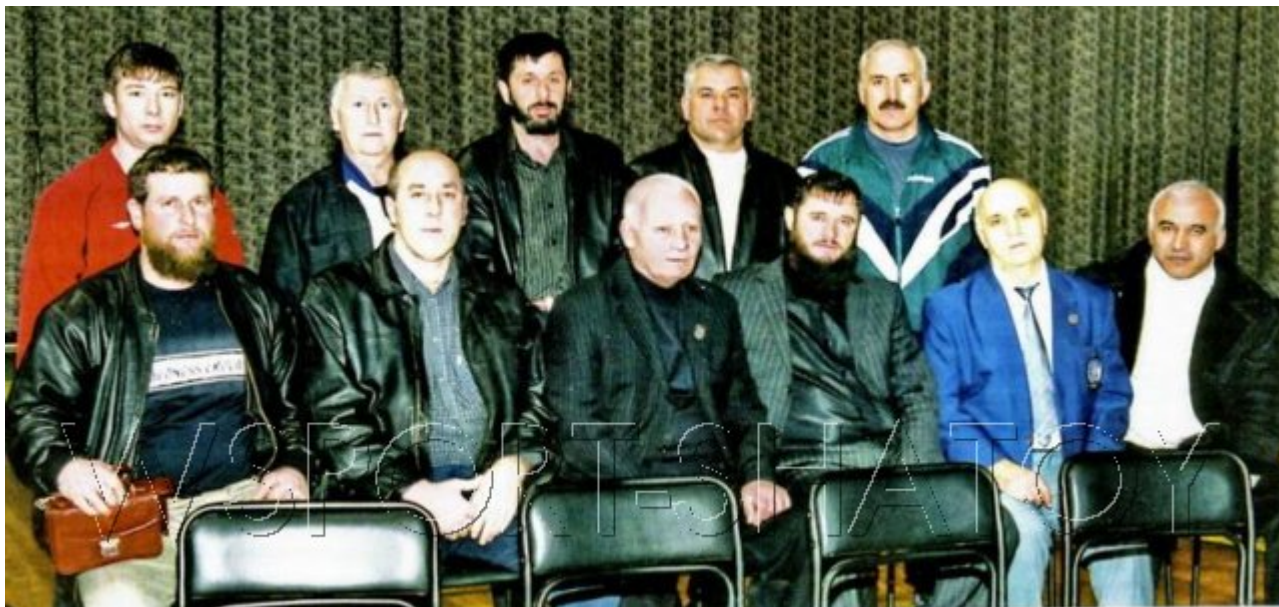
2006 год, Невинномысск, турнир Кадырова-Чемеркина. Эли стои второй слева.