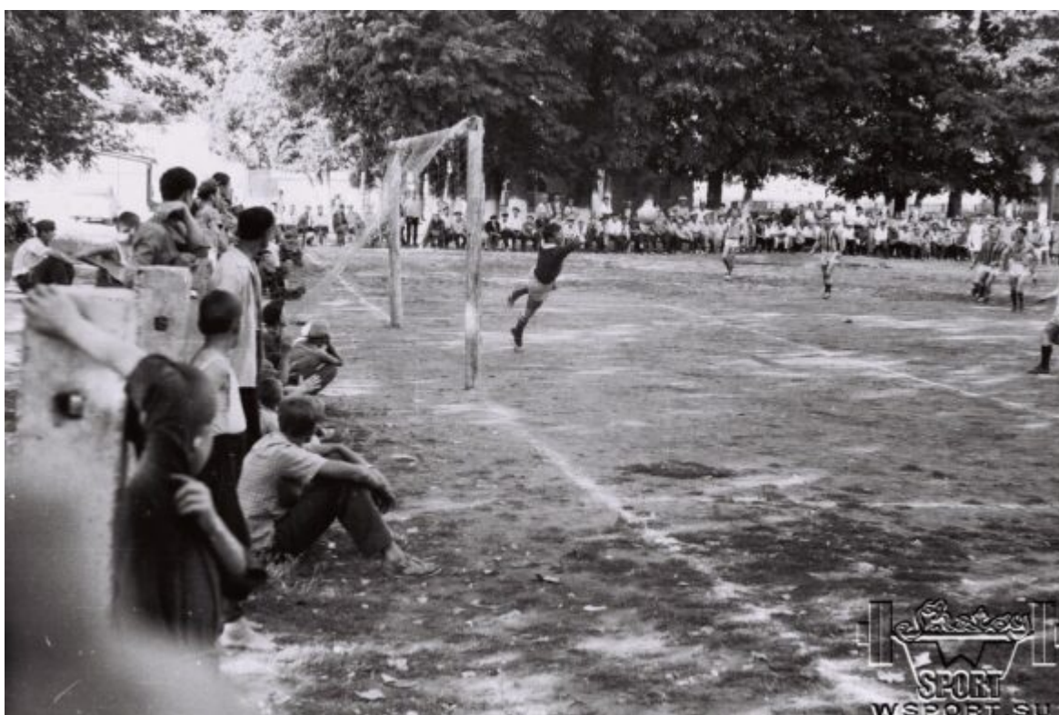
Матчи чемпионата ЧИАССР в с.Советском (Шатое)

В 1965 году, в 8-м классе, я почти регулярно играл за взрослую команду Советского района. Обязательно забивал гол, они меня хвалили и это меня – юношу сильно мотивировало. В 1966 году был чемпионат республики, играли в Первомайском и когда до конца игры оставалось где-то 20 минут меня выпустили на поле и