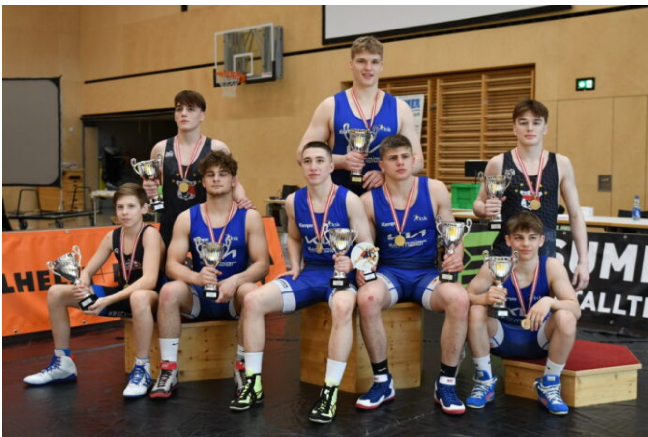
Победители и призеры в греко-римской борьбе.