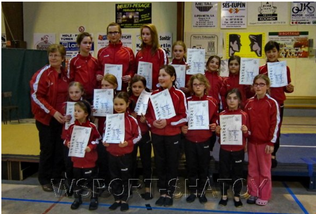
Команда гимнастического клуба Келмис