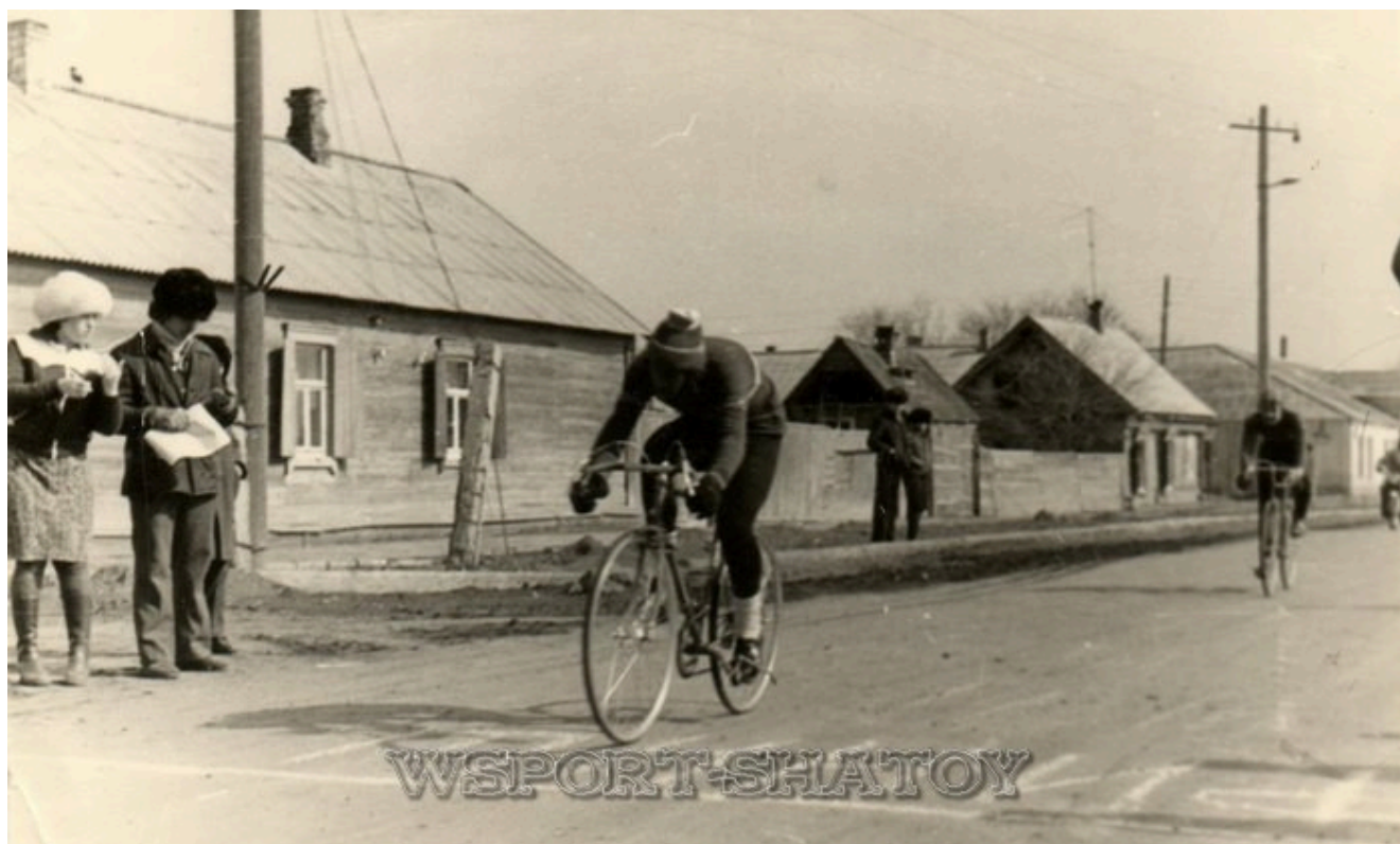
Чемпионат Астраханской области, 1978г.

Победитель и призёр чемпионатов юга Франции (2003-2008гг.).