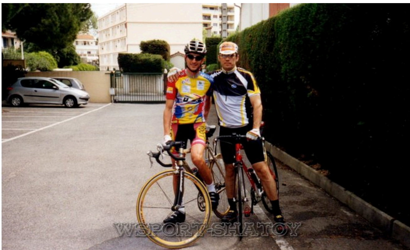
С чемпионом Франции Винсентом Жае.