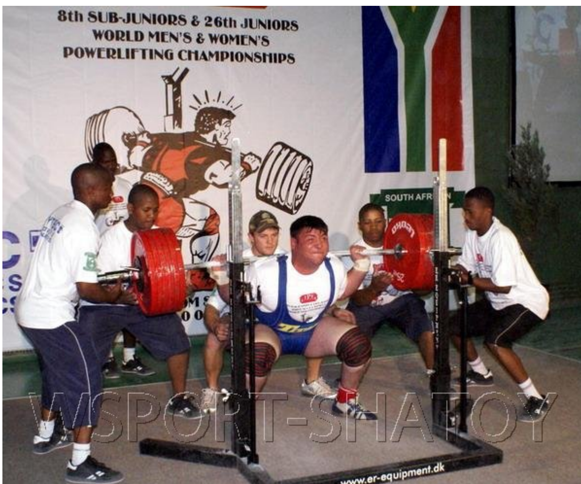
Есть мировой рекорд!