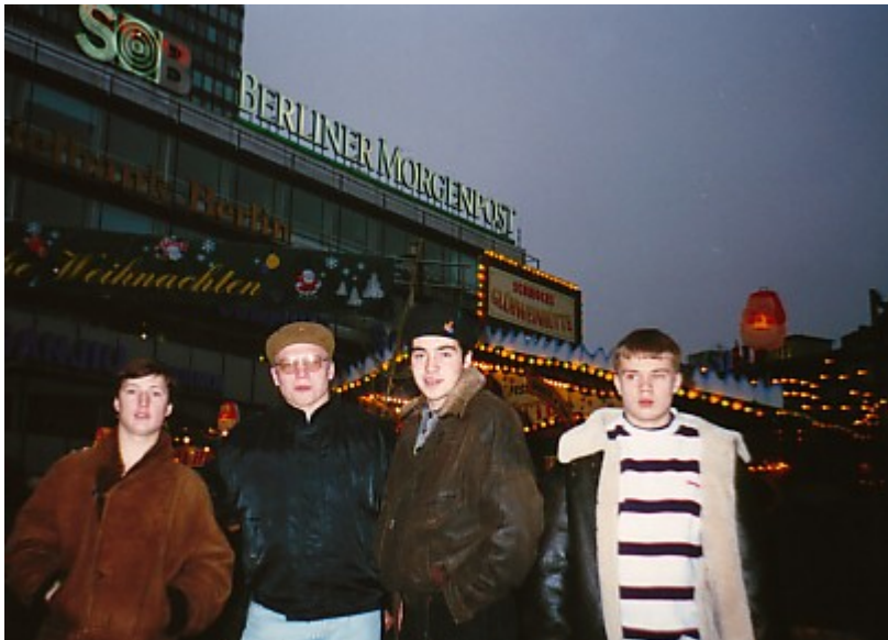
Западный Берлин, 1996г.