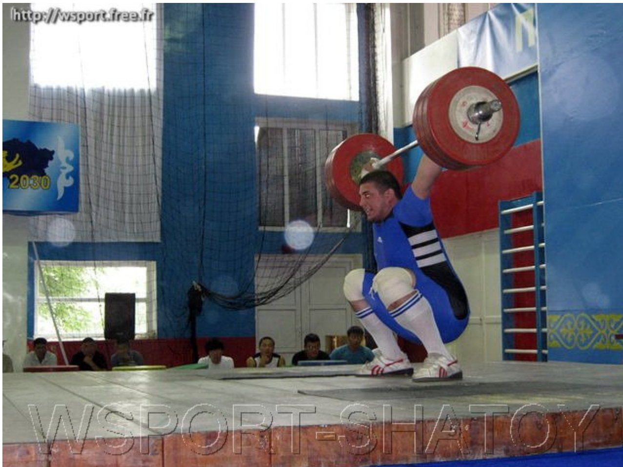
Рывок 185 кг на чемпионате Казахстана