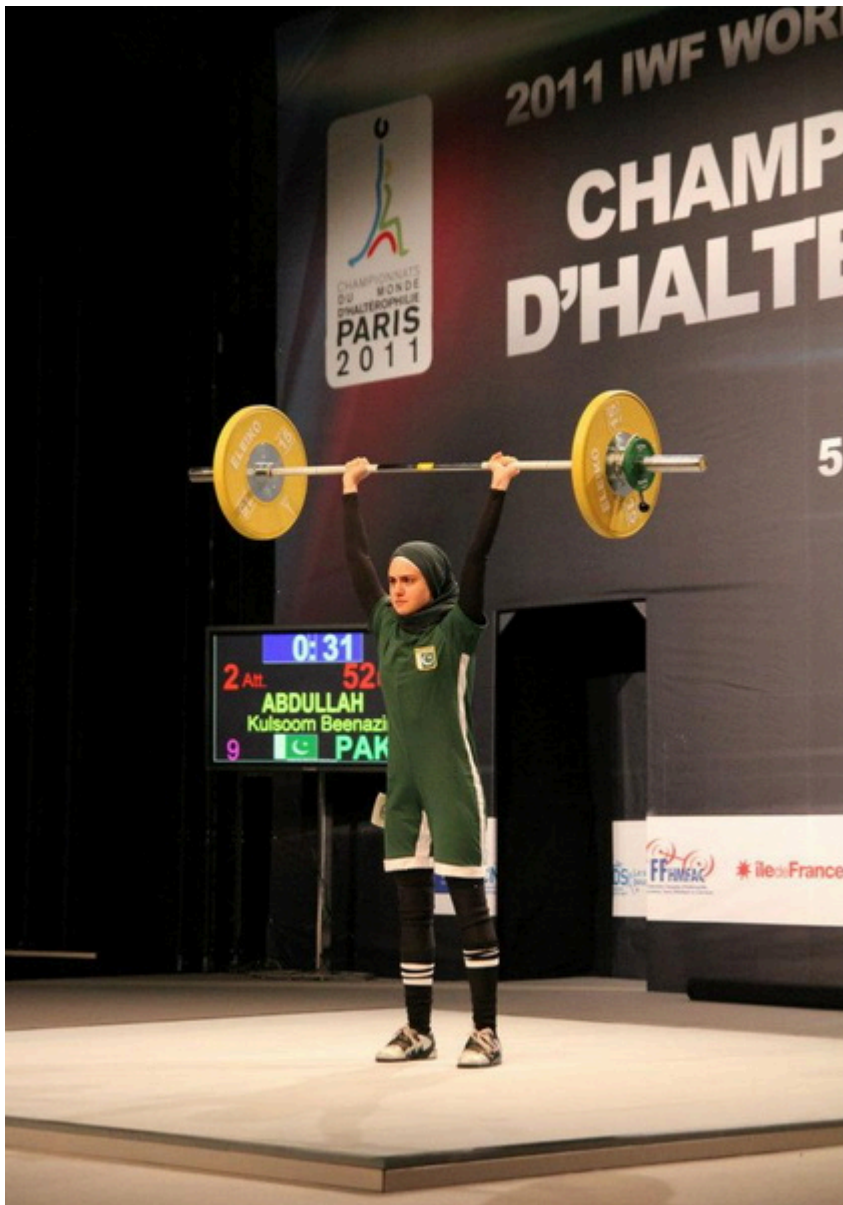
На чемпионате мира-2011 в Париже