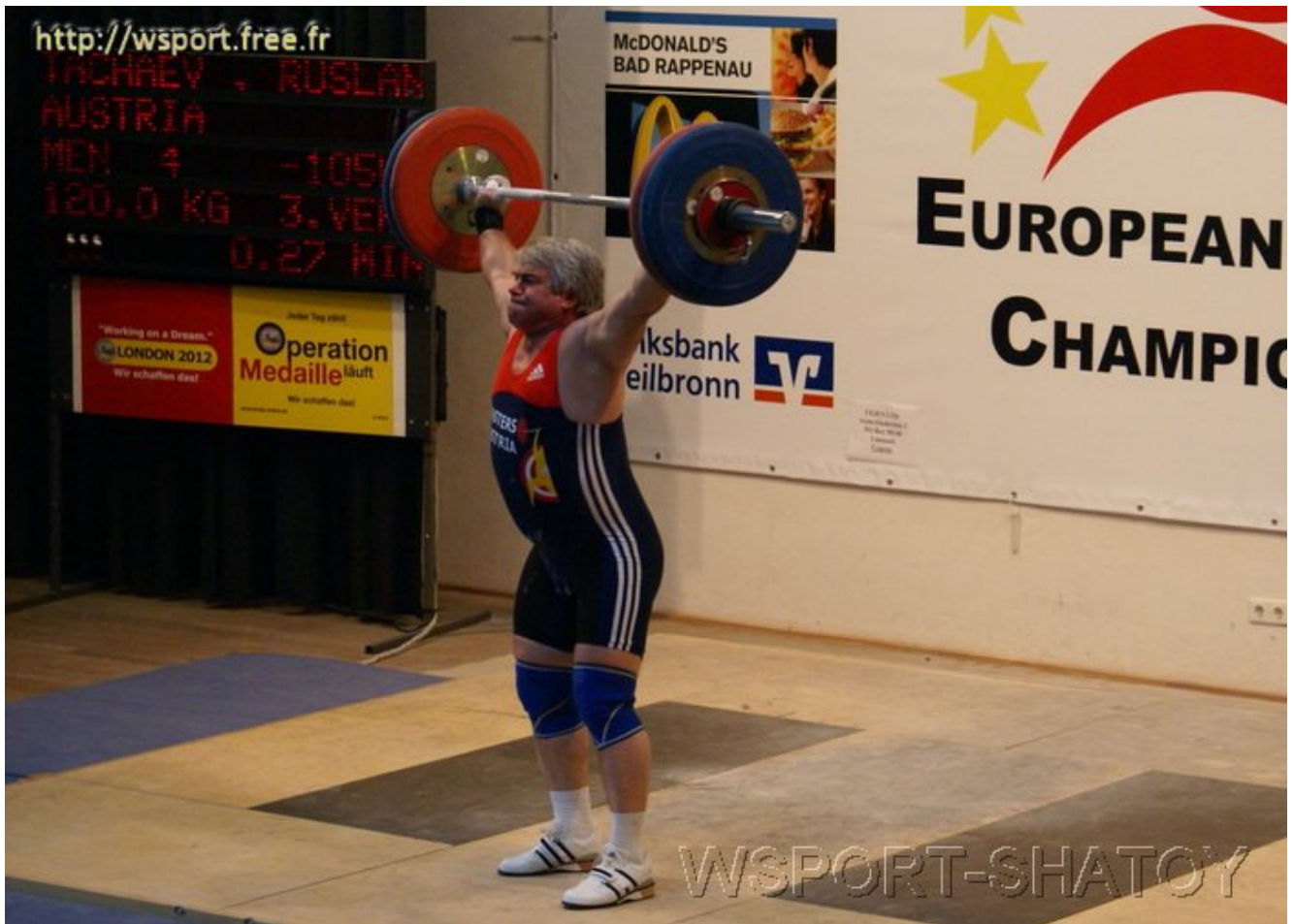
Рывок 120 кг