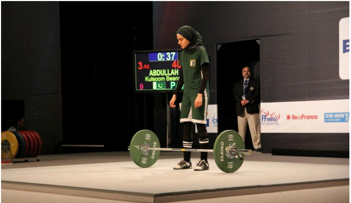
На чемпионате мира-2011 в Париже