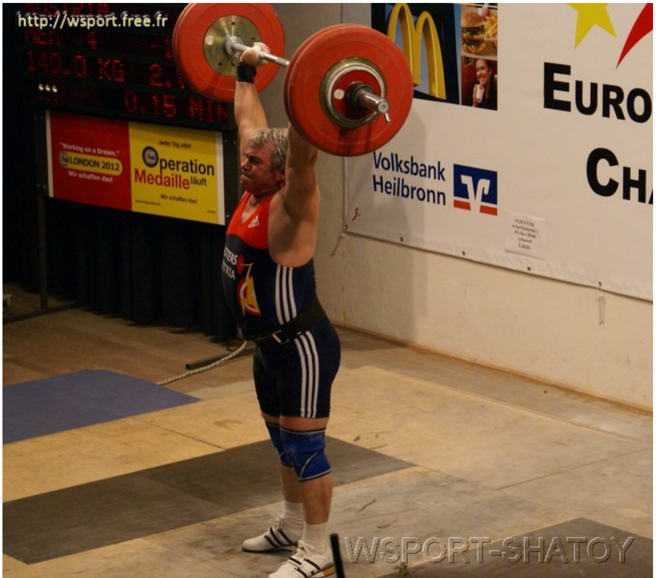
Толчок 140 кг