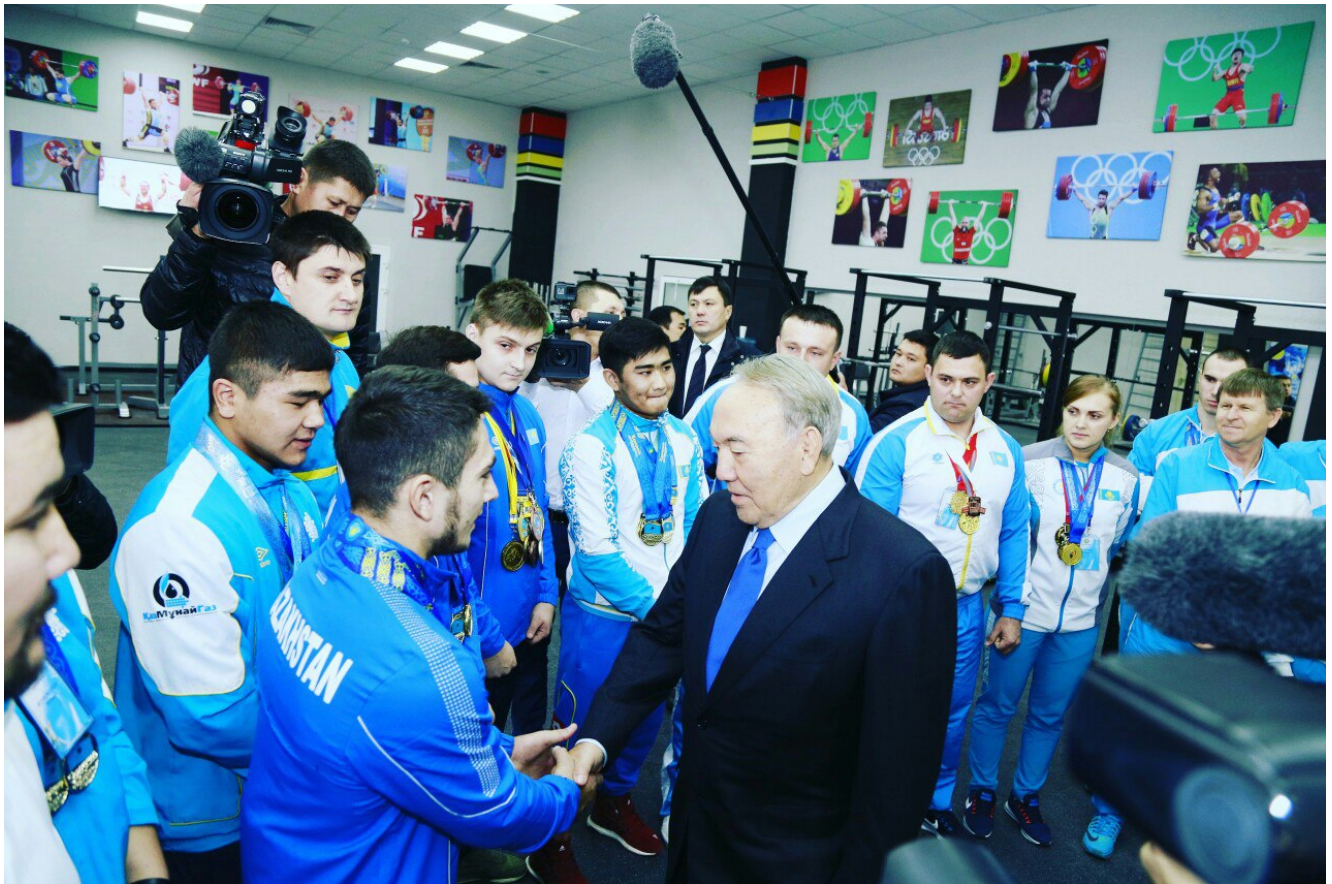
С президентом Казахстана Нурсултаном Назарбаевым