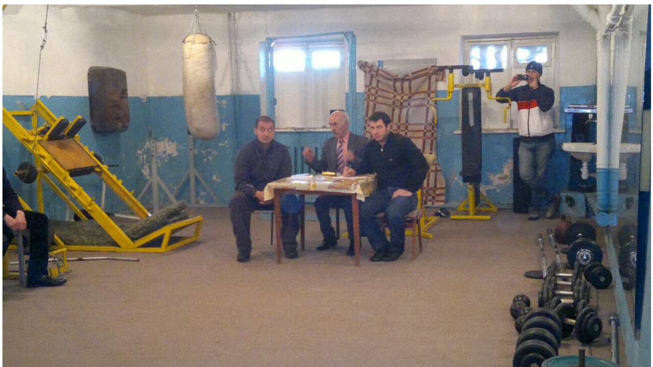
Так выглядели тренировочные залы в Чечне на рубеже XXI века