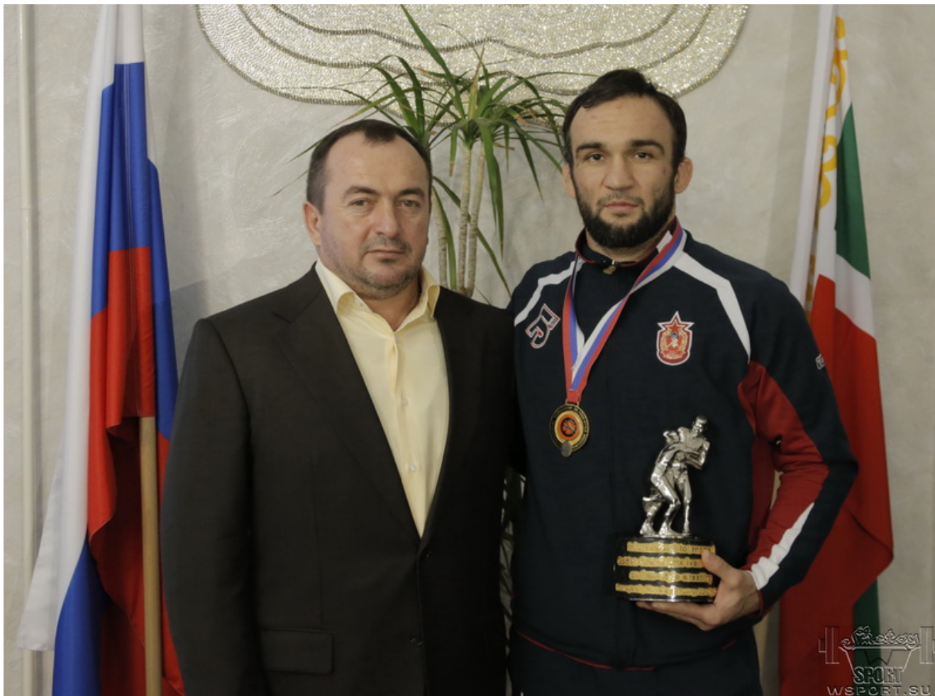
С министром спорта ЧР Х.Хизриевым