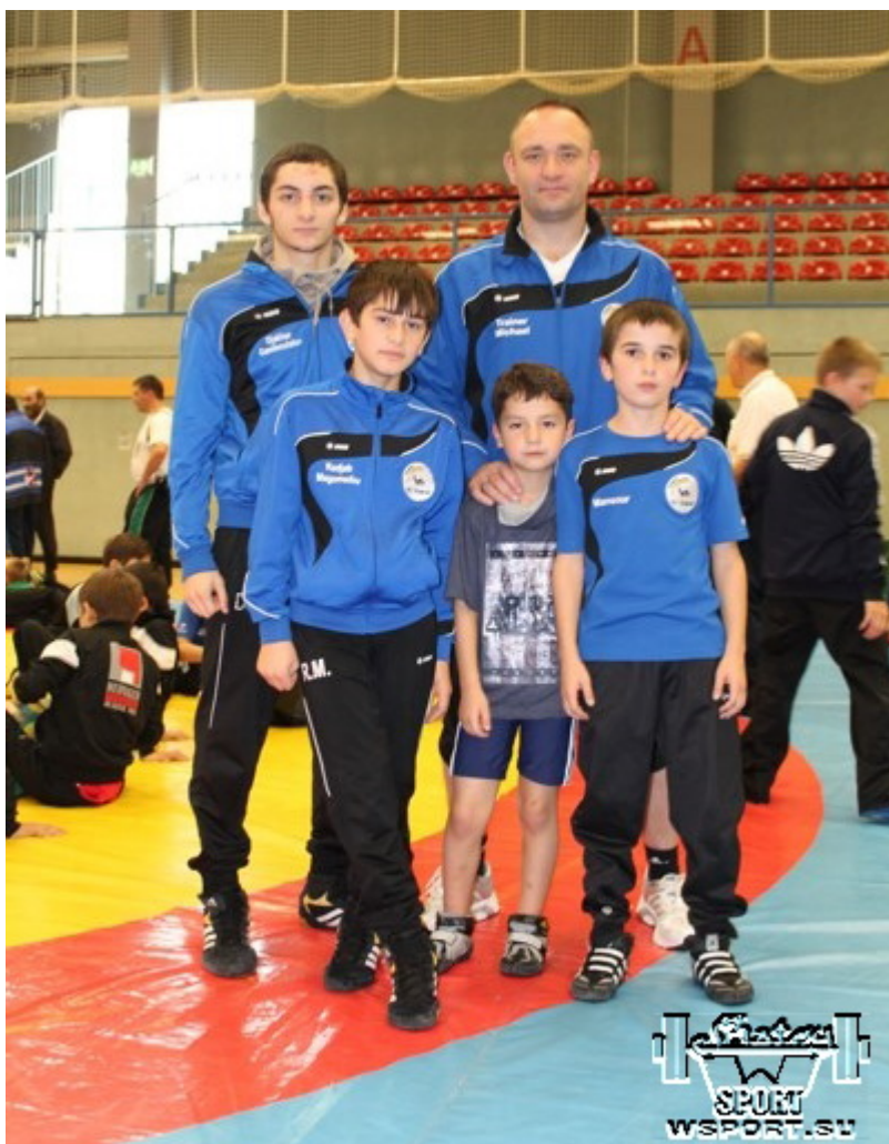
Команда Раерена из Бельгии