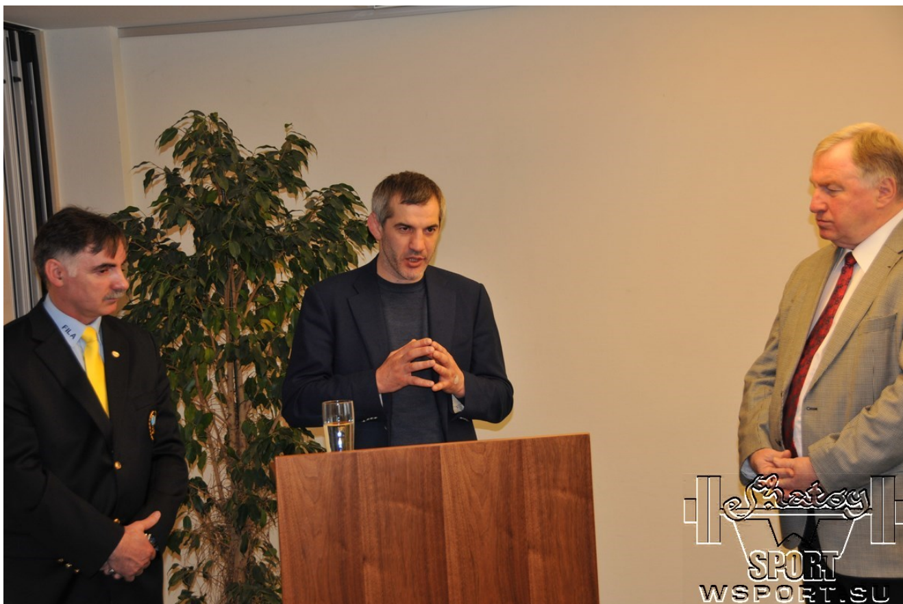
Слово взял Бувайсар Сайтиев