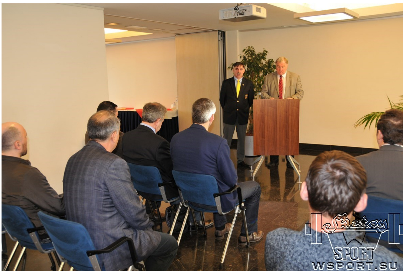
Министр-Президент выступил с краткой речью, где приветствовал проведение турнира в его регионе