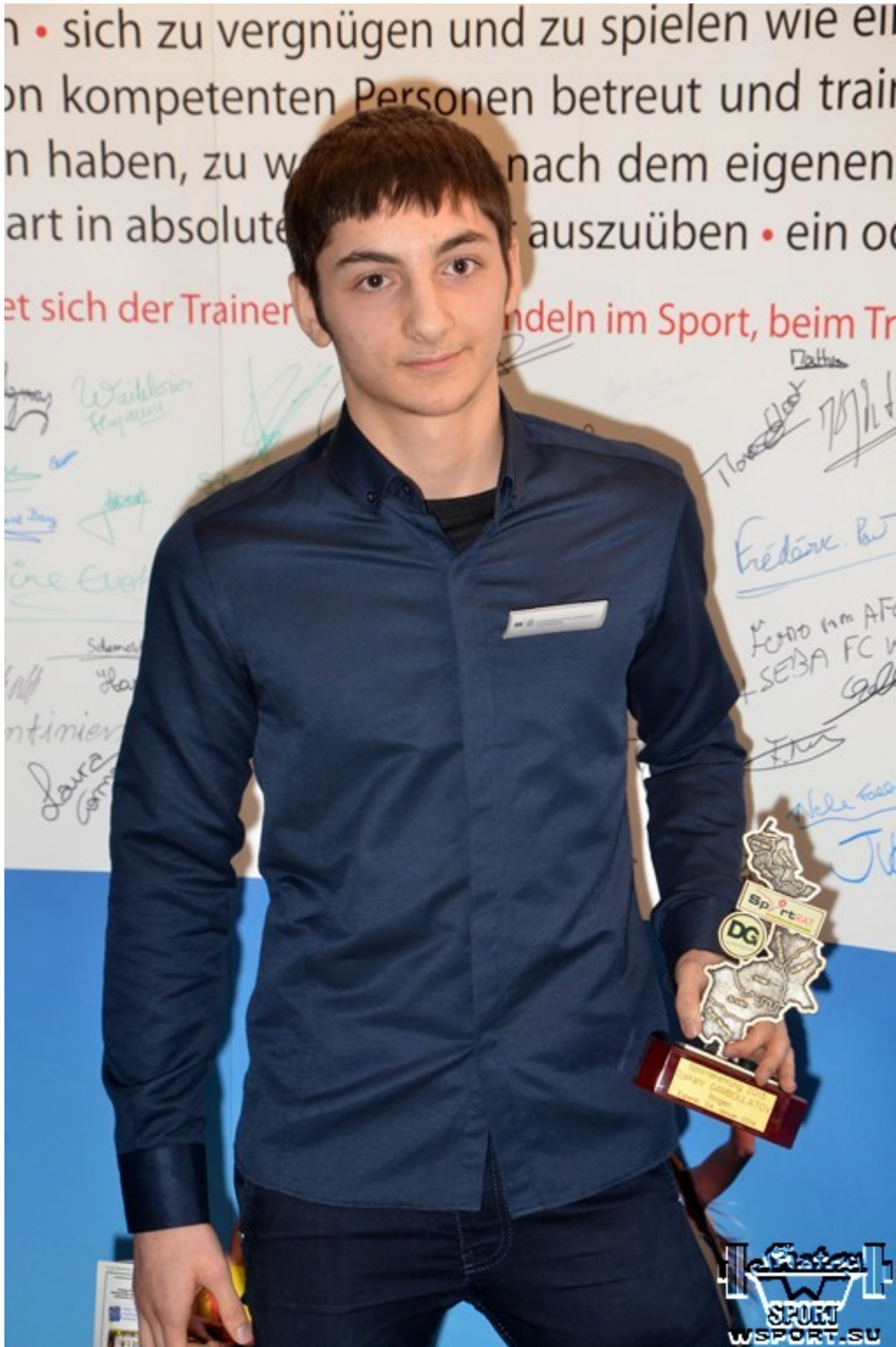
Лучший спортсмен В.Бельгии