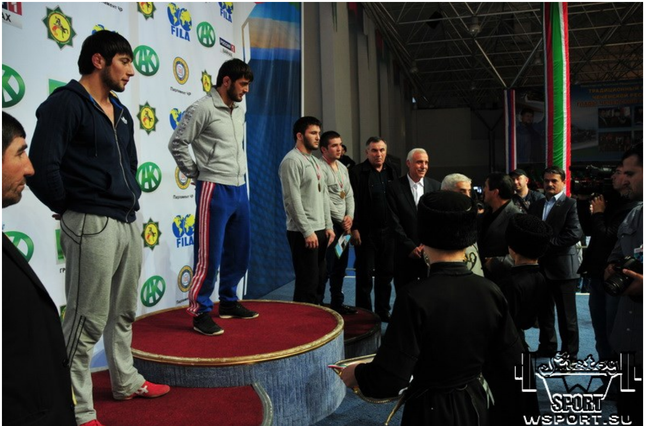
Парламентский турнир-2013, Грозный