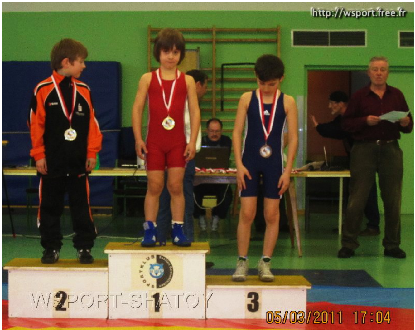
Чемпион Байсангур Мусаев, 3-е место Малик Дадакаев