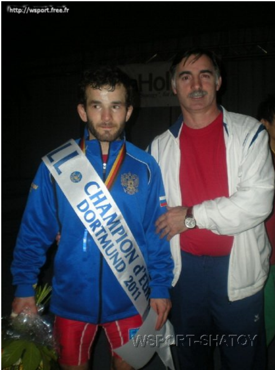
Чемпион Европы Джамал Отарсултанов