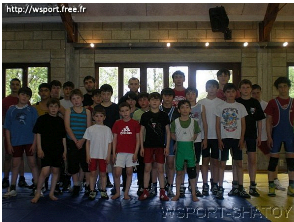
Вайнахские спортсмены на тренировочном сборе