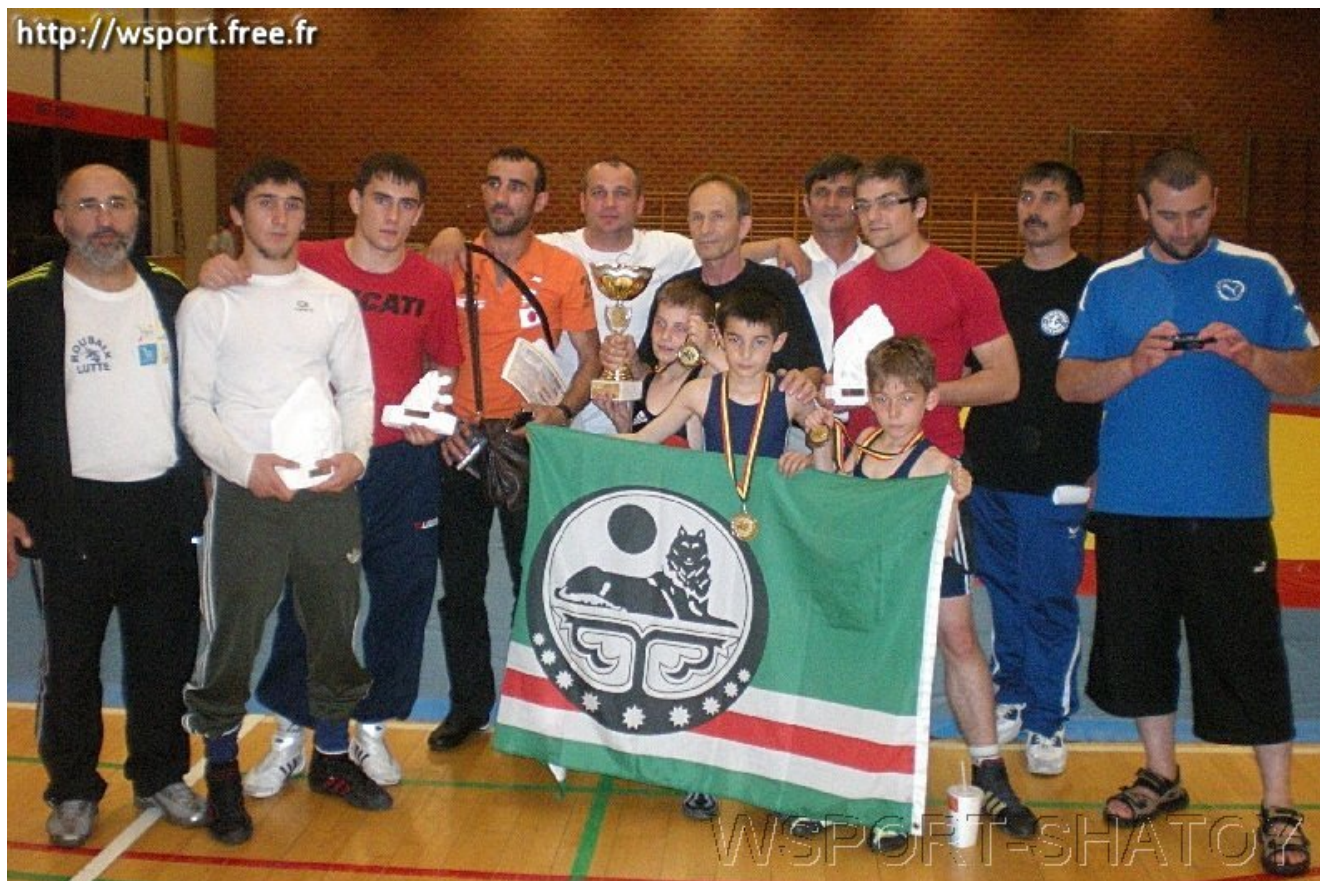
Тренеры и спортсмены после соревнований