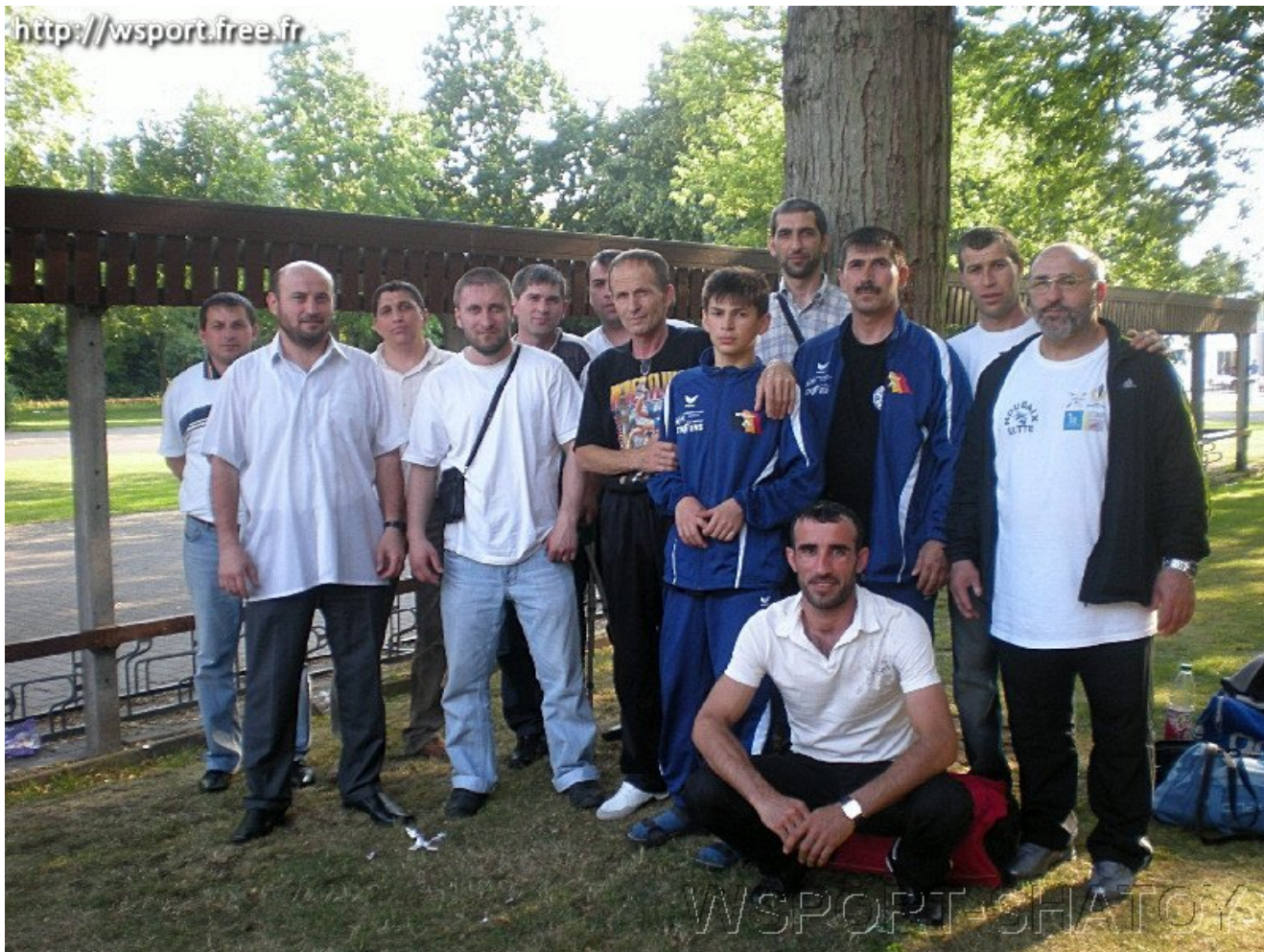
Вайнахские спортсмены и тренеры из разных стран Европы