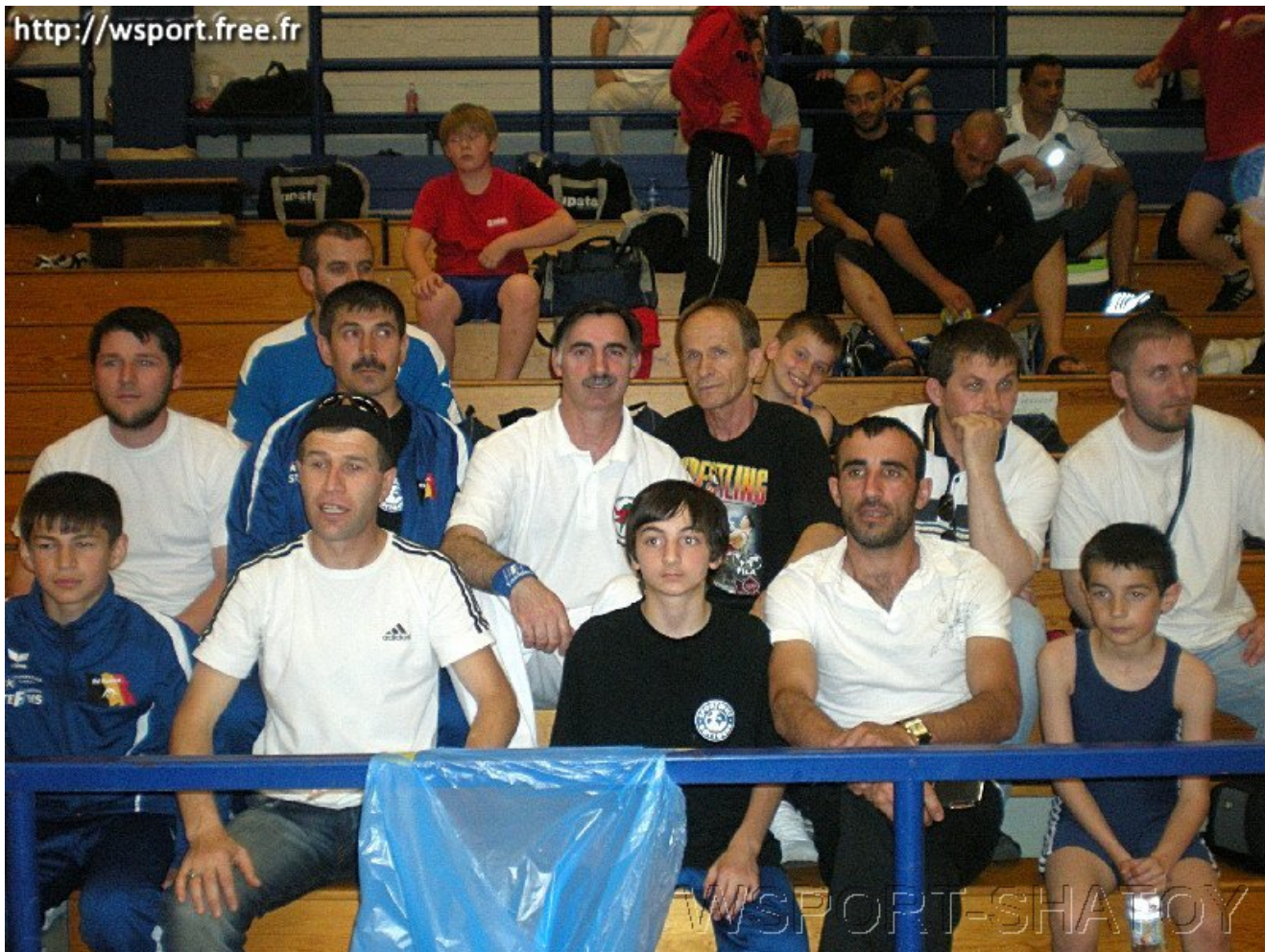
Спортсмены, тренеры, болельщики, родители