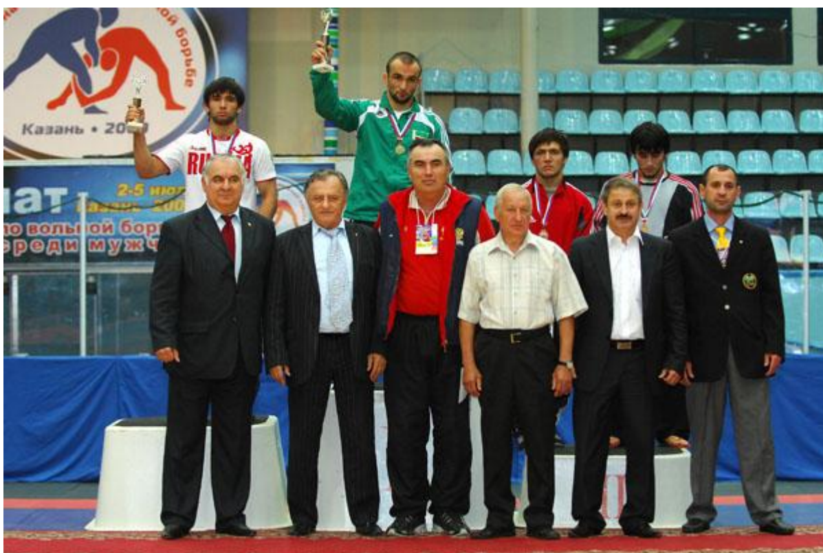
Чемпионат России 2009 года в Казани. Церемония награждения призеров весовой категории 66 кг, где чемпионом стал чеченский