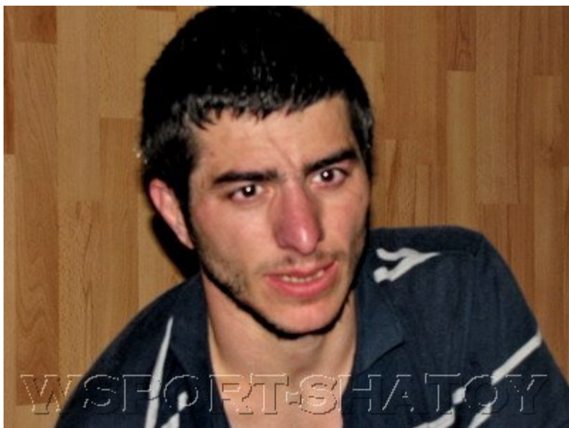
Чемпион Франции Руслан Ойсангуров