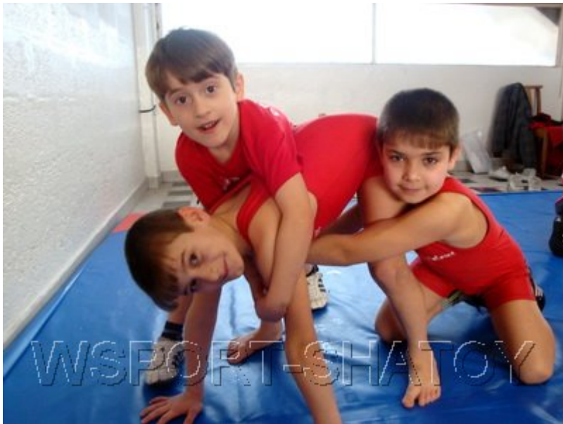
Два на одного - нечестно!