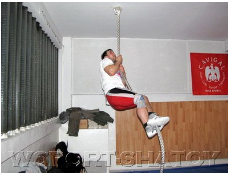
Муслим тренируется не меньше своих учеников