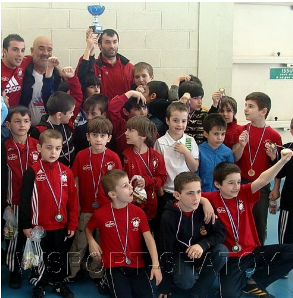
Команда "Кавигаль" берет очередной Кубок.