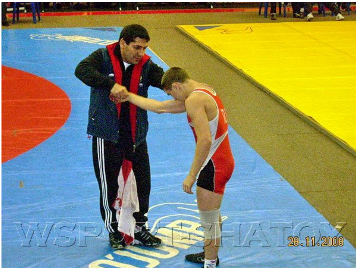
Знаменитый чеченский борец греко-римского стиля, 4-кратный чемпион мира, серебряный призер Олимпийских Игр-92 Ислам Дугучиев работает ныне тренером сборной России