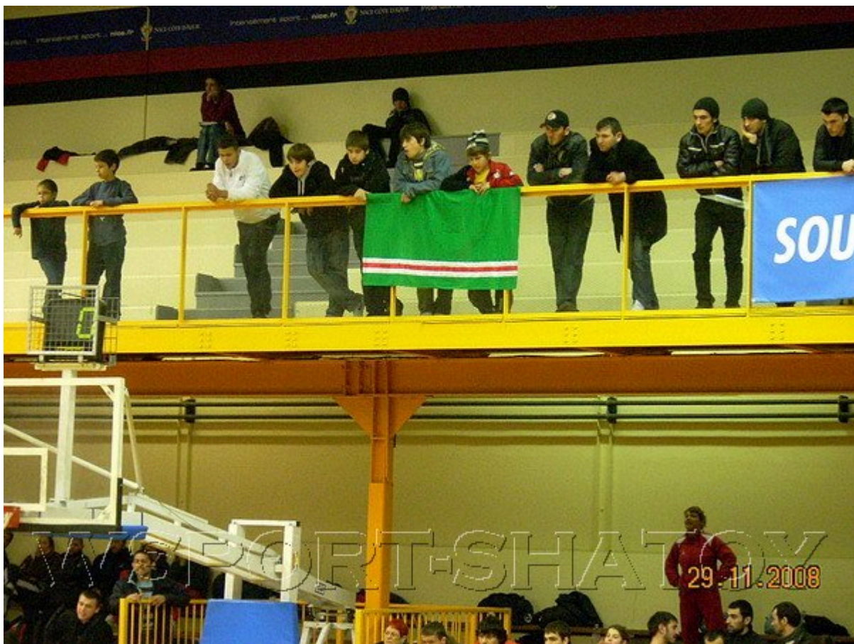
Чеченский флаг на трибуне