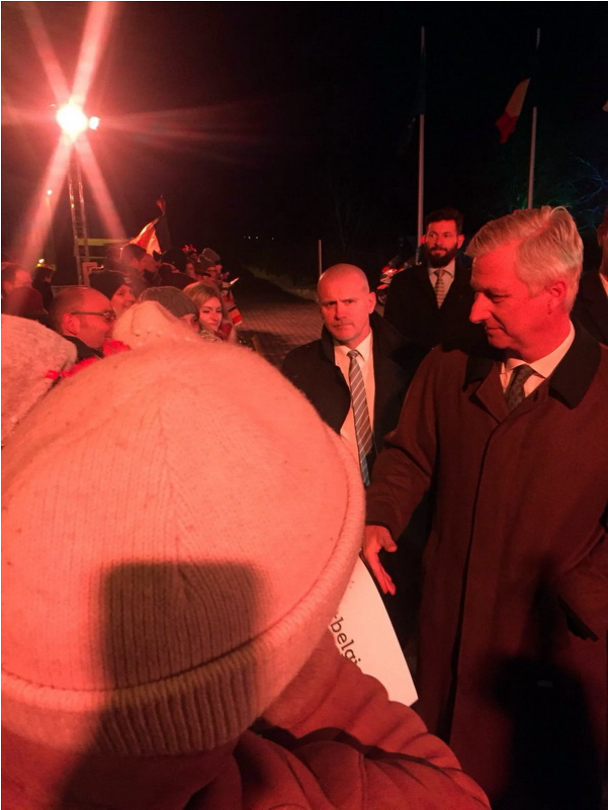
Король Бельгии Филипп.