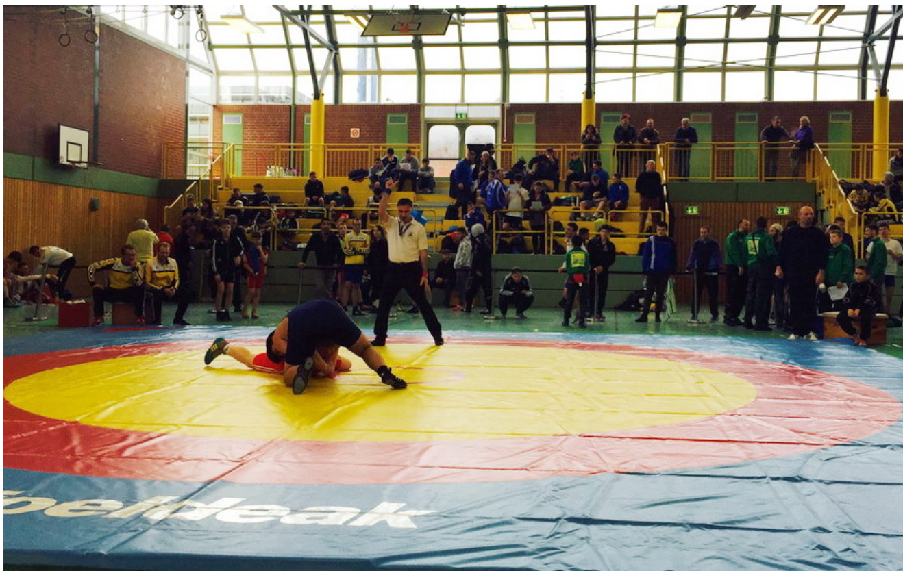
Судья на ковре Иса Гамбулатов