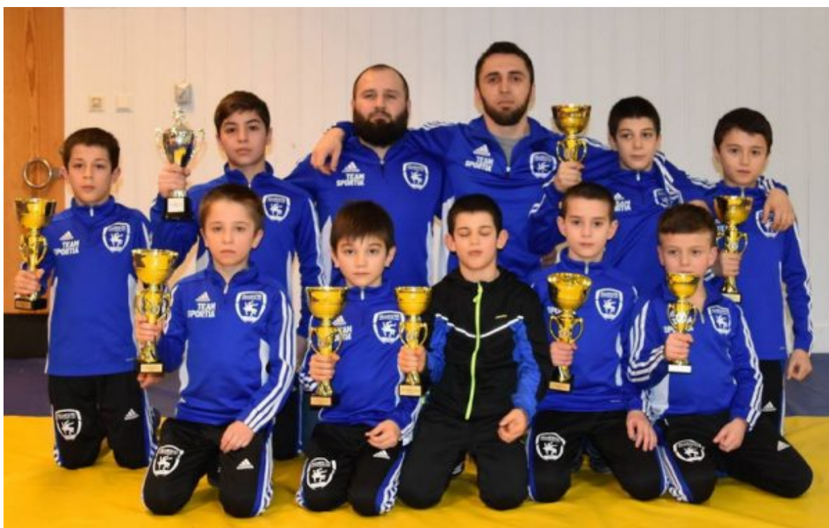
БК «Альвеста» на Кубке Мелар

В командном зачете БК «Альвеста» вышел на 3-е место, что является большим успехом для молодого клуба.