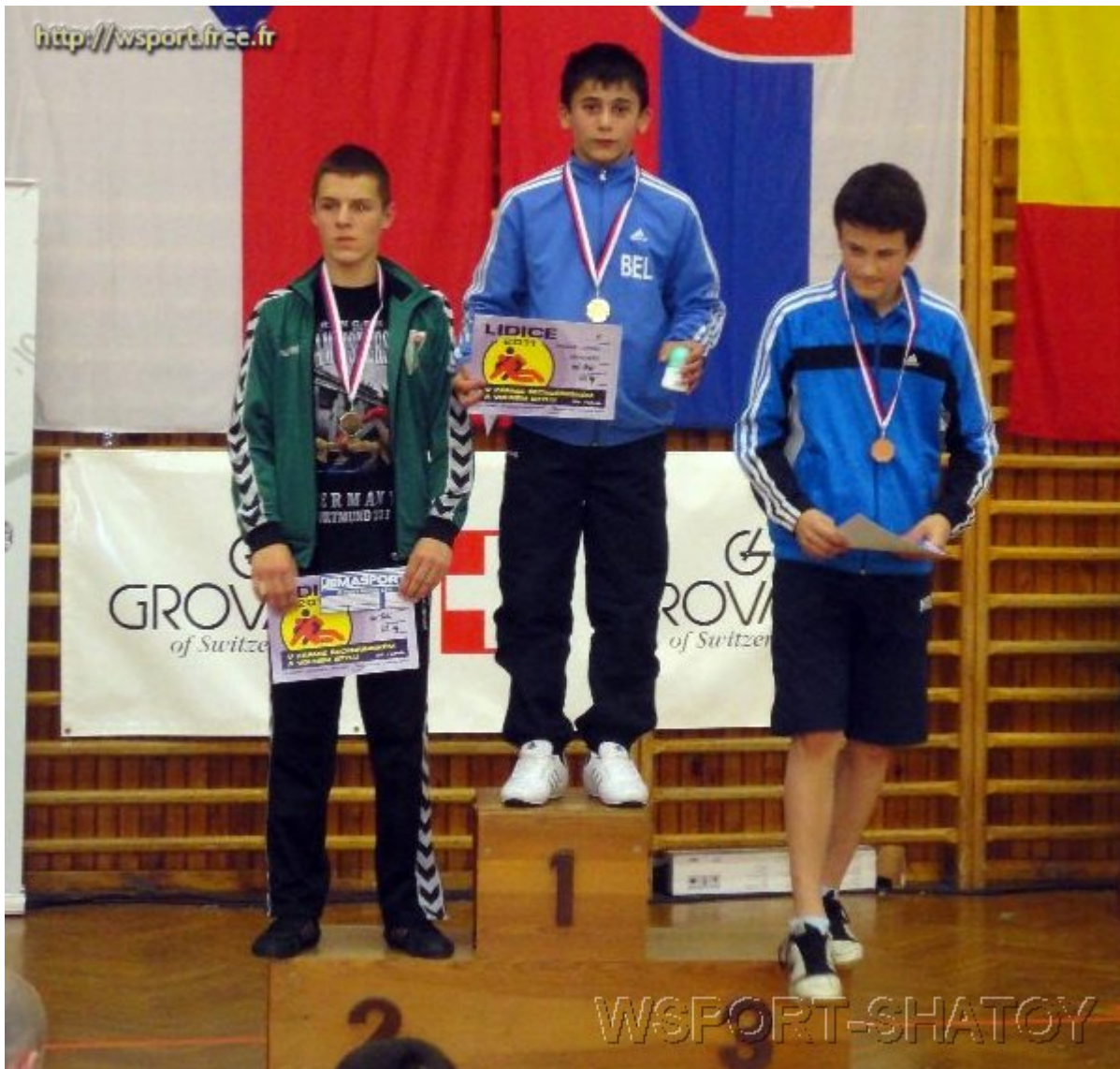
Чемпион Якуб Томов