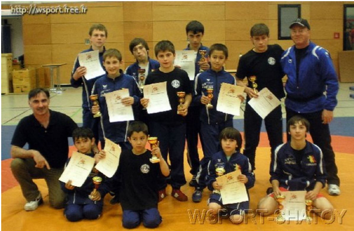
Команда "Paeren 2006"