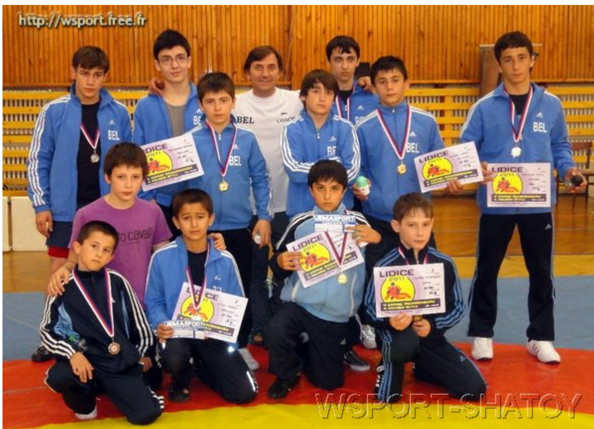
Команда спортклуба Вервье