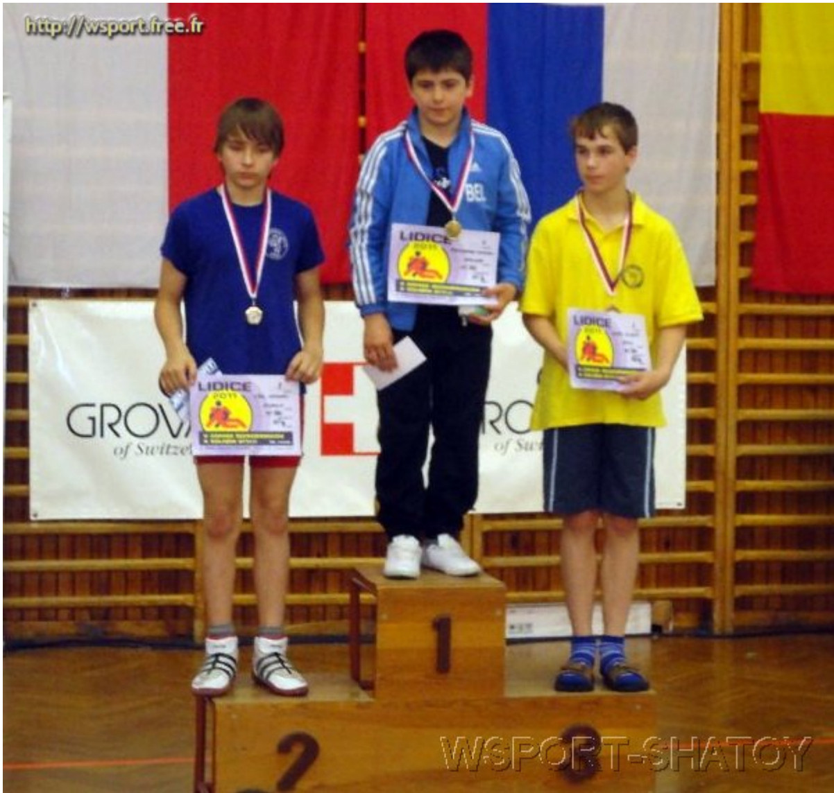
Чемпион Абубакар Тутаев