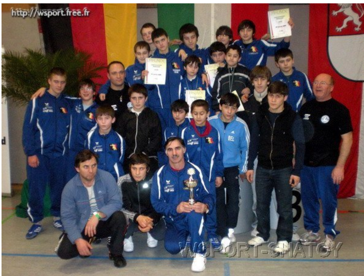
Наши в Германии